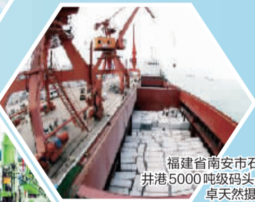
福建省南安市石井港5000吨级码头。