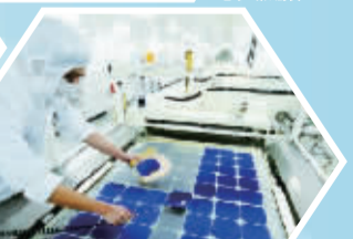
泉州(南安)光电信息产业基地荣获“国家高新技术产业化基地”、“海峡两岸科技产业合作基地”等称号。图为园区内南安三鼎阳光电力有限公司生产车间一角。