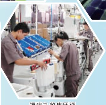
福建九牧集团通过科技创新提高产品科技含量,产品受到市场广泛青睐。图为九牧集团生产线。

南安是典型的工业主导型县级市,工业对全市经济发展起着“主心骨”的作用,工业兴则南安旺,只有实现工业经济质效的大跨步提升,建设现代创业创新型经济强市才有强有力的基础和保障。要实现这些目标,尤为重要是推动创新转型。