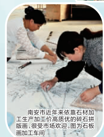
南安市近年来依靠石材加工生产加工高质优的碎石拼版画,很受市场欢迎。图为石板加工车间。