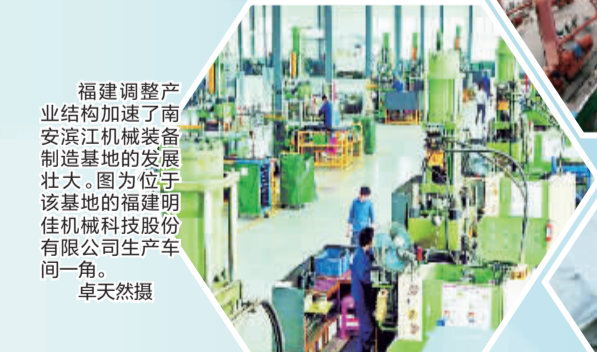
福建调整产业结构加速了南安滨江机械装备制造基地的发展壮大。图为位于该基地的福建明佳机械科技股份有限公司生产车间一角。