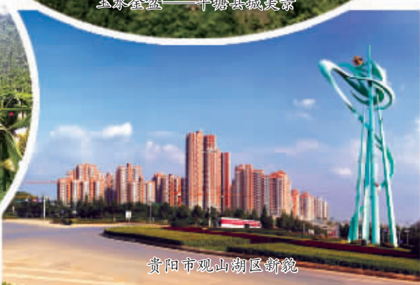
贵阳市观山湖区新貌