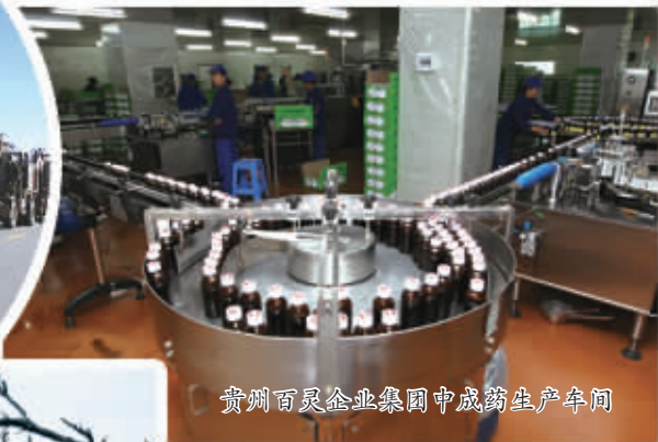
贵州百灵企业集团中成药生产车间