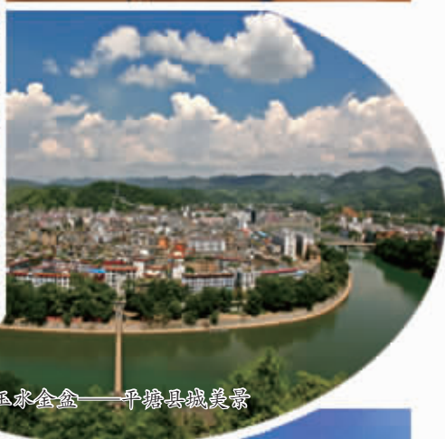
玉水金盆——平塘县城美景