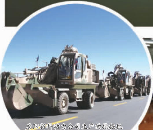
贵阳新科动力公司生产的挖掘机