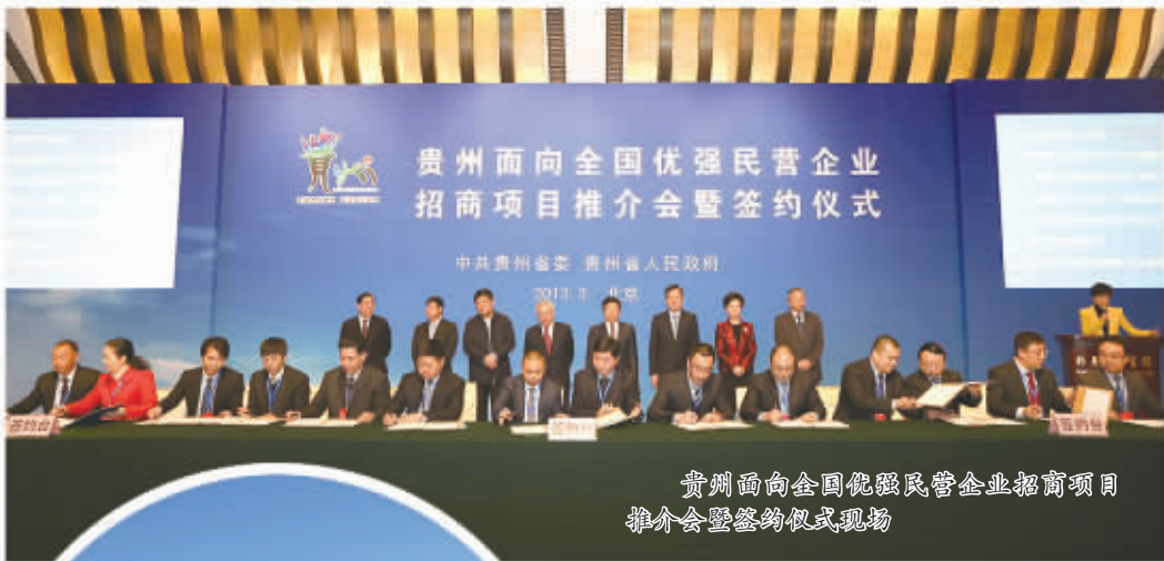
贵州面向全国优强民营企业招商项目推介会暨签约仪式现场

—— 重点打造100个旅游景区。 立足于文化与旅游深度融合，着眼于创新旅游业态和转变发展方式，加强旅游景区品质品牌建设，深入挖掘文化内涵，打造著名旅游目的地，提高旅游产业竞争力和带动力。加强旅游景区基础设施建设，提高旅游景区的便利性和舒适性。加强旅游景区综合管理和功能配套，提高旅游景区的服务质量和管理水平。加强旅游景区整体包装、对外宣传和市场营销，提高旅游景区知名度和影响力。办好第八届贵州旅游产业发展大会，带动和促进全省旅游业快速发展。