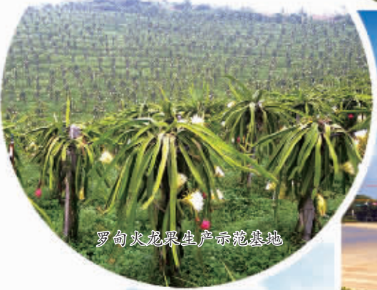
罗甸火龙果生产示范基地