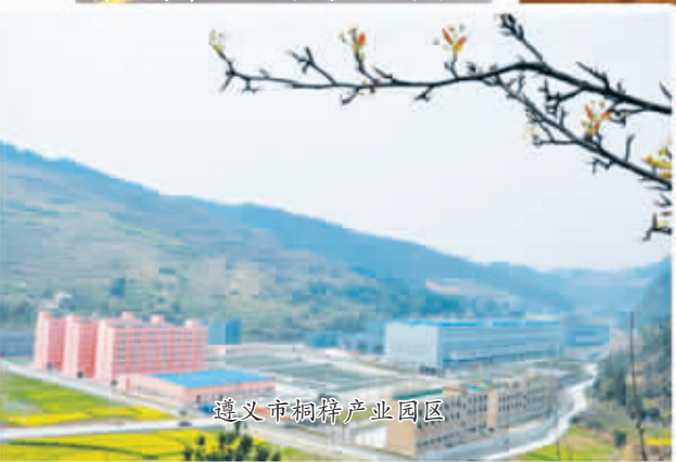
遵义市桐梓产业园区