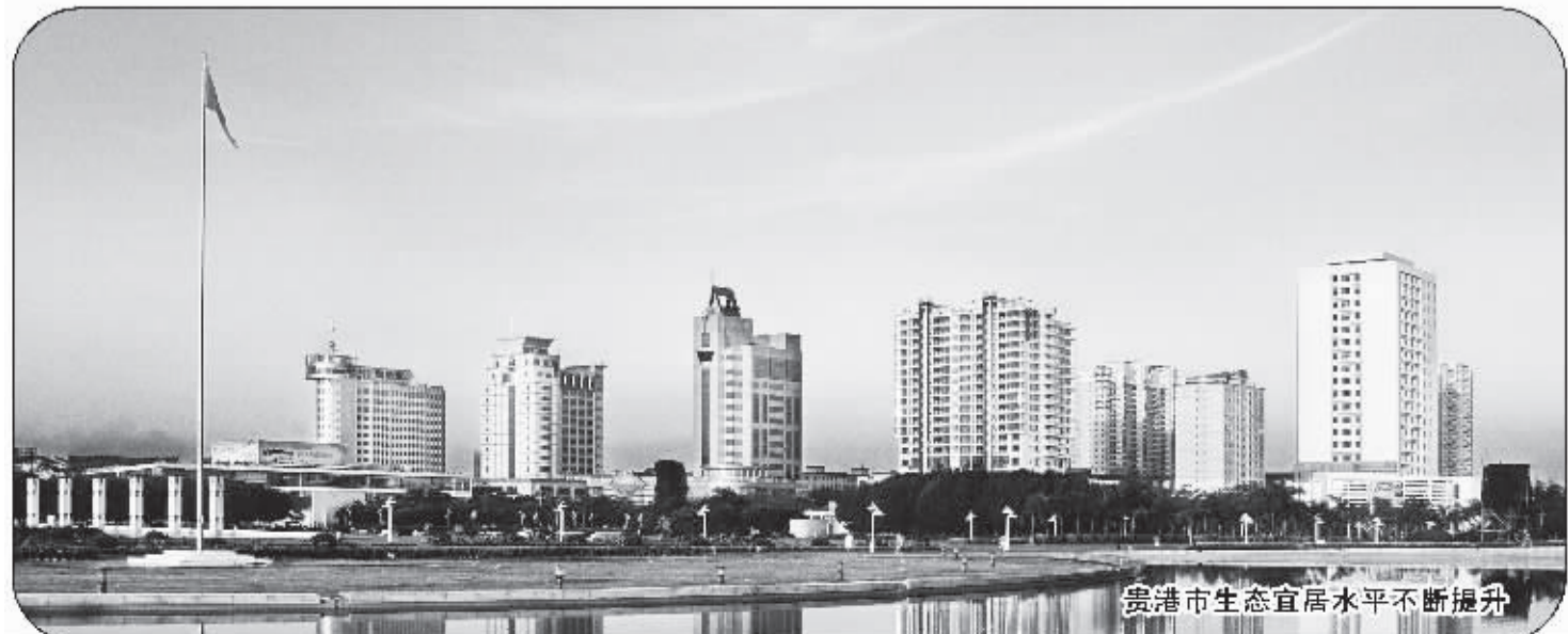
贵港市生态宜居水平不断提升