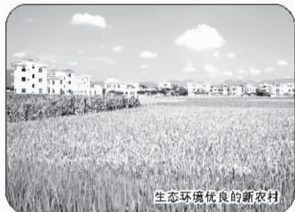
生态环境优良的新农村

——一江连东西，一港活三江。贵港正携手沿江各市，推进区域经济一体化发展，努力使西江经济带开发建设上升为国家战略。随着西江黄金水道建设的不断深入，到2015年，贵港港货物吞吐能力将达到7200万吨和60万标准箱，将发展成为西江黄金水道的中转枢纽和区域性物流基地。