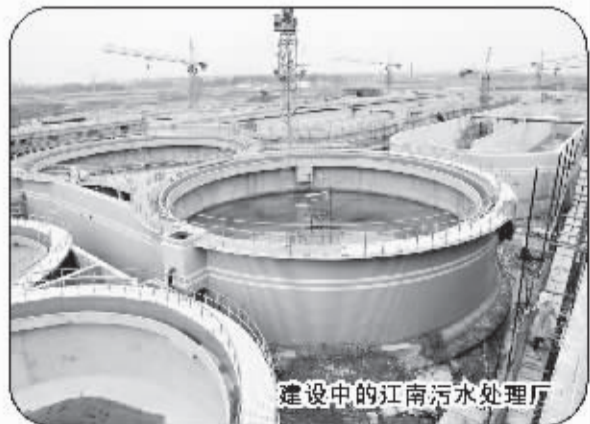
建设中的江南污水处理厂