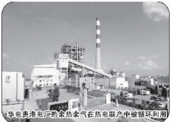
华电贵港电厂的余热余气在热电联产中被循环利用