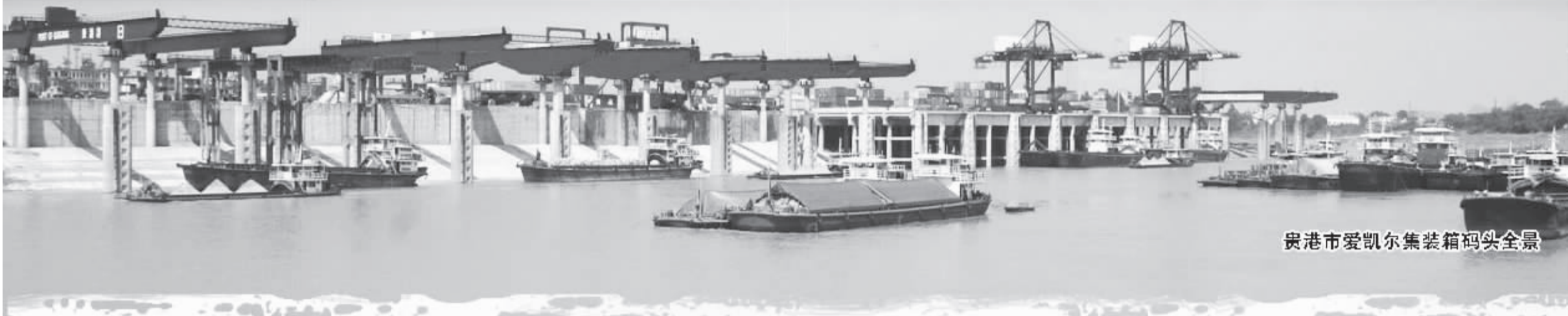
贵港市爱凯尔集装箱码头全景

承东接西，年吞吐量超四千万吨，西南、华南内河航运龙头高昂出贵港。港口兴、园区旺、城市美，物流自东西南北汇聚，产业集群溯江而来，西江黄金水道在促进区域经济社会协调发展中的潜力，正逐渐在贵港呈现出来。而贵港的发展，也显示出西江经济带巨大的活力与广阔的前景。