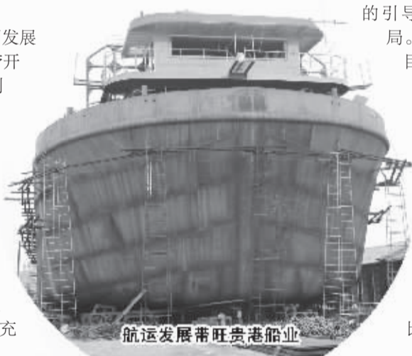
航运发展带旺贵港船业

近年来，贵港市努力打造西江黄金水道、推动区域协调发展的战略部署，紧紧围绕“把贵港建设成为西江流域核心港口城市”的战略目标，抓住难得的历史机遇，充