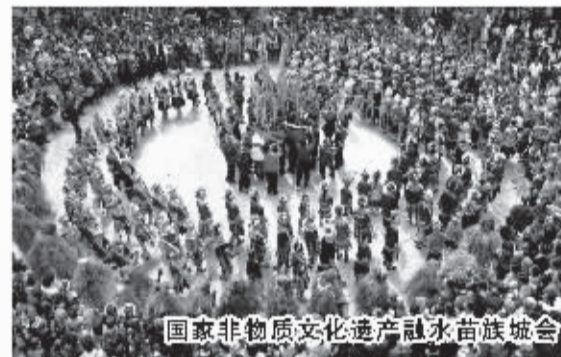
国家非物质文化遗产融水苗族集会