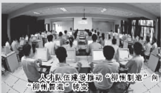
人才队伍建设推动“柳州制造”向“柳州智造”转变