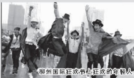
柳州国际狂欢节上狂欢的年轻人