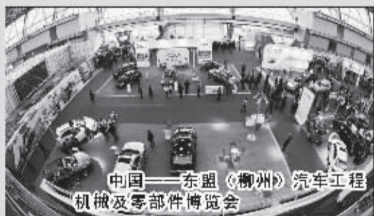
中国—东盟《柳州》汽车工程机械及零部件博览会