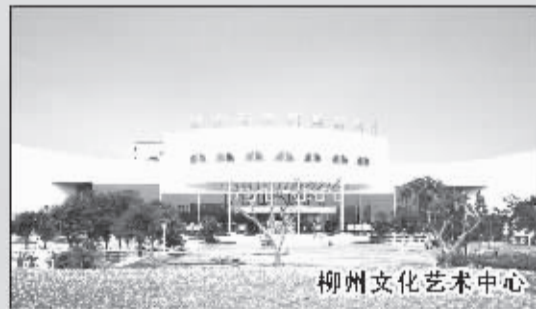
柳州文化艺术中心