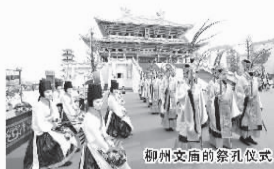
柳州文庙的祭孔仪式