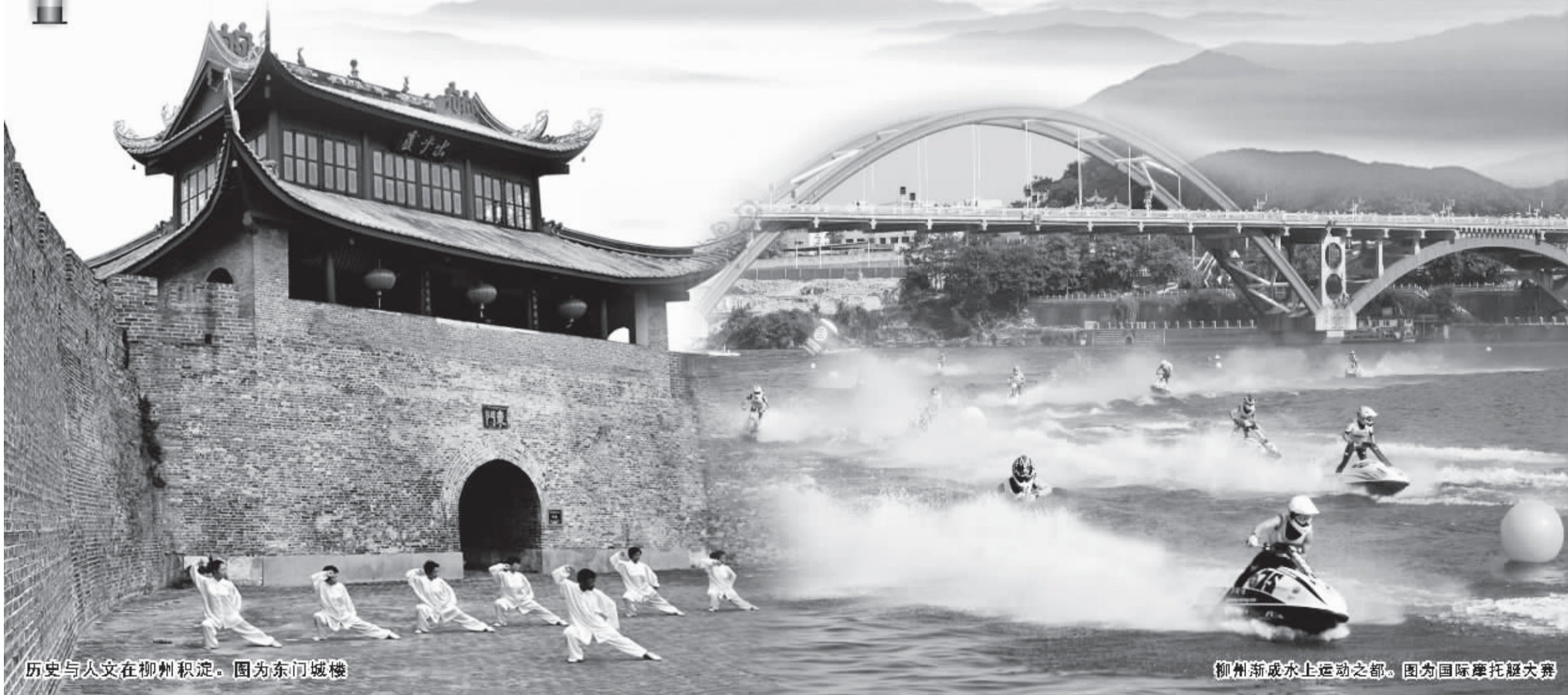
历史与人文在柳州积淀。图为东门城楼