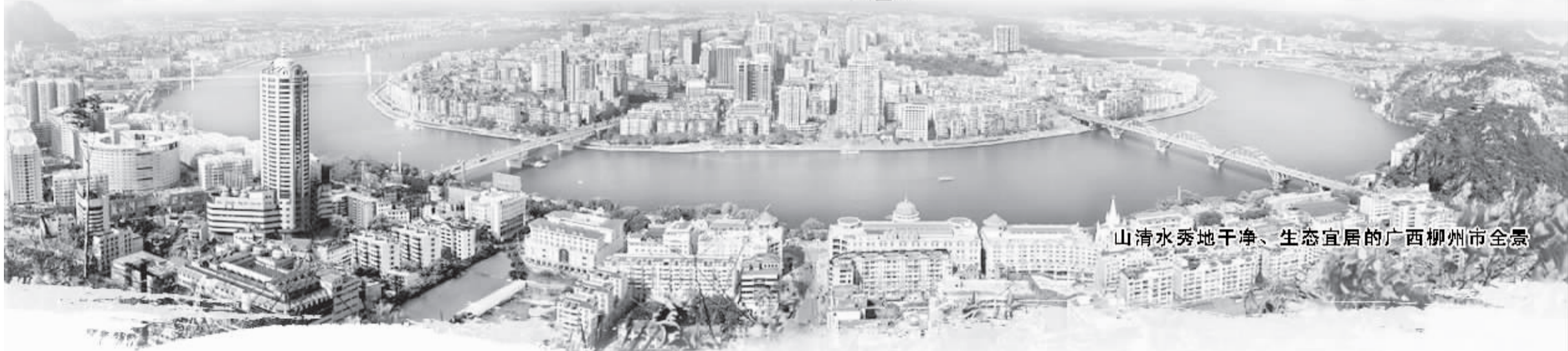
山清水秀地干净、生态宜居的广西柳州市全景