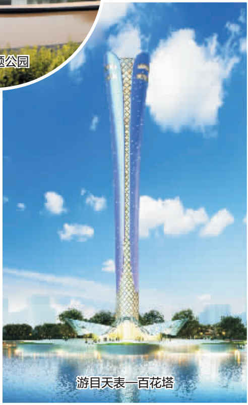
游目天表一百花塔