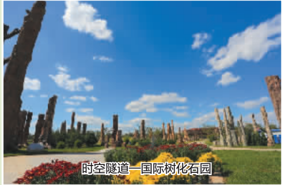
时空隧道—国际树化石园