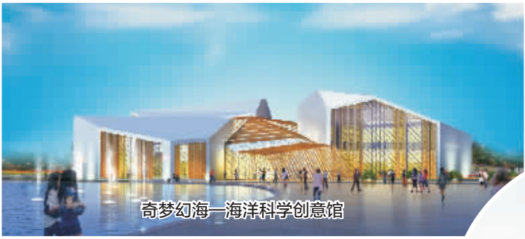
奇幻海—海洋科学创意馆

主轴的核心节点,以IFLA国际展园为主体,从全球征集的百余件作品中优选20个集世界风景园林艺术之大成的特色庭院,与海洋科学创意馆、渤海湾水景、多条花带等共同构成错落有致、赏心悦目的中央景观。