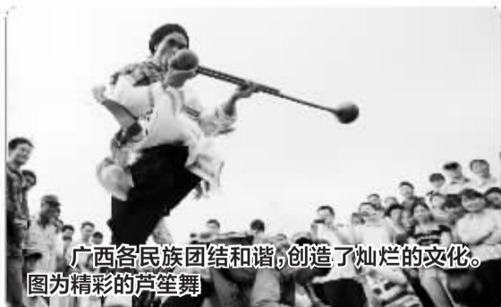
广西各民族团结和谐,创造了灿烂的文化。图为精彩的芦笙舞