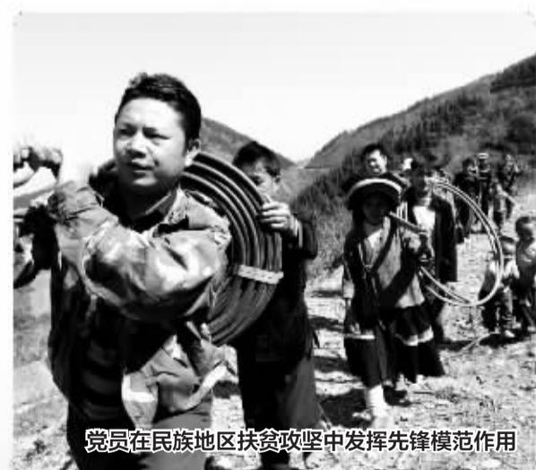
党员在民族地区扶贫攻坚中发挥先锋模范作用

为贯彻落实中央关于改进工作作风、密切联系群众的八项规定,中共广西壮族自治区委员会审议通过《中共广西壮族自治区委员会贯彻落实中央关于改进工作作风、密切联系群众有关规定的实施意见》。《实施意见》包括5个方面30条具体要求,内容包括改进调查研究、精简会议活动和文件简报、规范出访活动、改进新闻报道、加强督促检查。《实施意见》严格贯彻中央“八项规定”,结合广西实际对有关工作进行细化完善和规范,提出了一系列切实可行的要求,确保转变作风的各项规定落到实处,以改进作风的实际成效树立形象、取信于民。