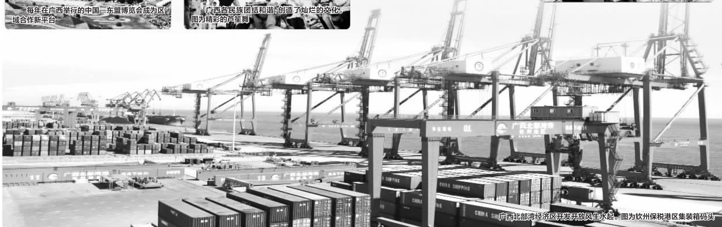
广西北部湾经济区开发开放风生水起。图为钦州保税港区集装箱码头