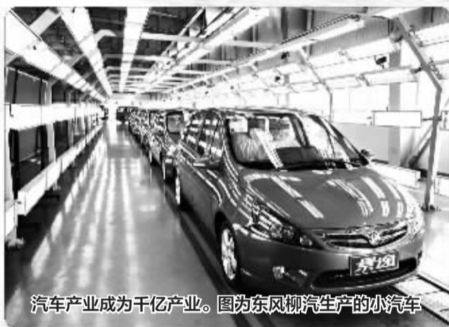
汽车产业成为千亿产业。图为东风柳汽生产的小汽车