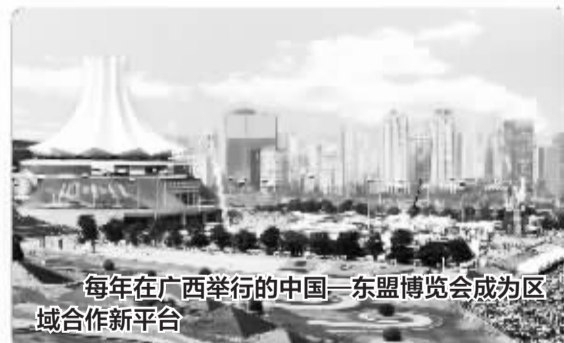
每年在广西举行的中国—东盟博览会成为区域合作新平台

在广西的具体表现,是广西人民崇高理想信念、高尚道德追求、优秀政治品格、良好精神风貌的结晶;它全面深刻地揭示了广西的人文特质、民族特质、区域特质,是一个有机的整体。广西精神将激发壮乡儿女的无限热情,汇集各族群众的强大力量,让热爱广西、建设广西、实现广西跨越式发展成为全区人民的自觉行动。