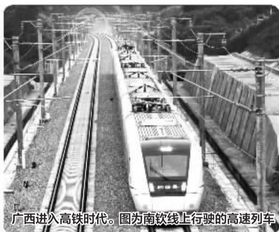
广西进入高铁时代。图为南钦线上行驶的高速列车

为了确保实现与全国同步建成小康社会的宏伟目标,广西将努力保持高于全国平均水平的广西速度,促进经济持续健康较快发展。到2017年地区生产总值达到2.7万亿元,比2012年翻1.05番;人均生产总值达到5.5万元,翻0.98番;财政收入达到3640亿元,翻1.01番;全社会固定资产投资达到3万亿元,翻1.25番;社会消费品零售总额达到9500亿元,翻1.09番。