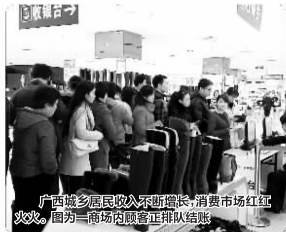
广西城乡居民收入不断增长,消费市场红红火火。图为一商场内顾客正排队结账

预计2013—2020年,农民人均纯收入年均增长14%,2020年达到1.67万元,比2010年翻1.88番。