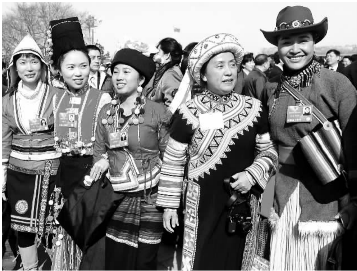
上图 3月3日下午,政协十二届一次会议在北京人民大会堂开幕,政协委员意气风发,步入会场。

每个议案、提案和建议的背后,都和代表委员们对经济社会发展持续的关注、长期的思考分不开。让我们共同倾听这些“老面孔”们的新故事,见证他们不懈的努力和坚守。