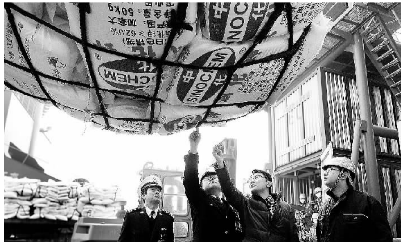
3月1日,海关工作人员正在连云港港口9号泊位对春耕生产农资进行快速验放。该港口是江苏、安徽、河南、山东等我国粮食主产区农资最佳进口口岸,是化肥进出口的主要通道。今年以来,该港海关设立农资验放绿色通道,实行24小时预约加班制度,优先办理化肥等农资的审单、纳税、放行手续,保证春耕物资快速通关。

本报北京3月1日讯 记者刘志奇报道:国内首个海洋输电实验基地日前在浙江舟山建成,该实验基地未来将围绕海洋输电工程设计、施工、运维,以及海缆工程深埋敷设、动力定位、故障定位和路径测试等开展科研活动。据介绍,该实验基地的部分研究成果已应用于生产实际,有效提高了海底电缆的输送容量、输送能力和供电可靠性。截至目前,该实验基地已申请专利19项,其中授权17项,发明专利6项。