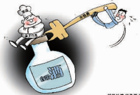
新华社发 翟乃万 作

小小“开瓶费”,一次次戳到消费者的痛处。消费者与商家间的“开瓶费”争拗,近年来一波接一波。许多群众热盼其能够认真破解“开瓶费”之类与民生关联密切的霸王行规问题。