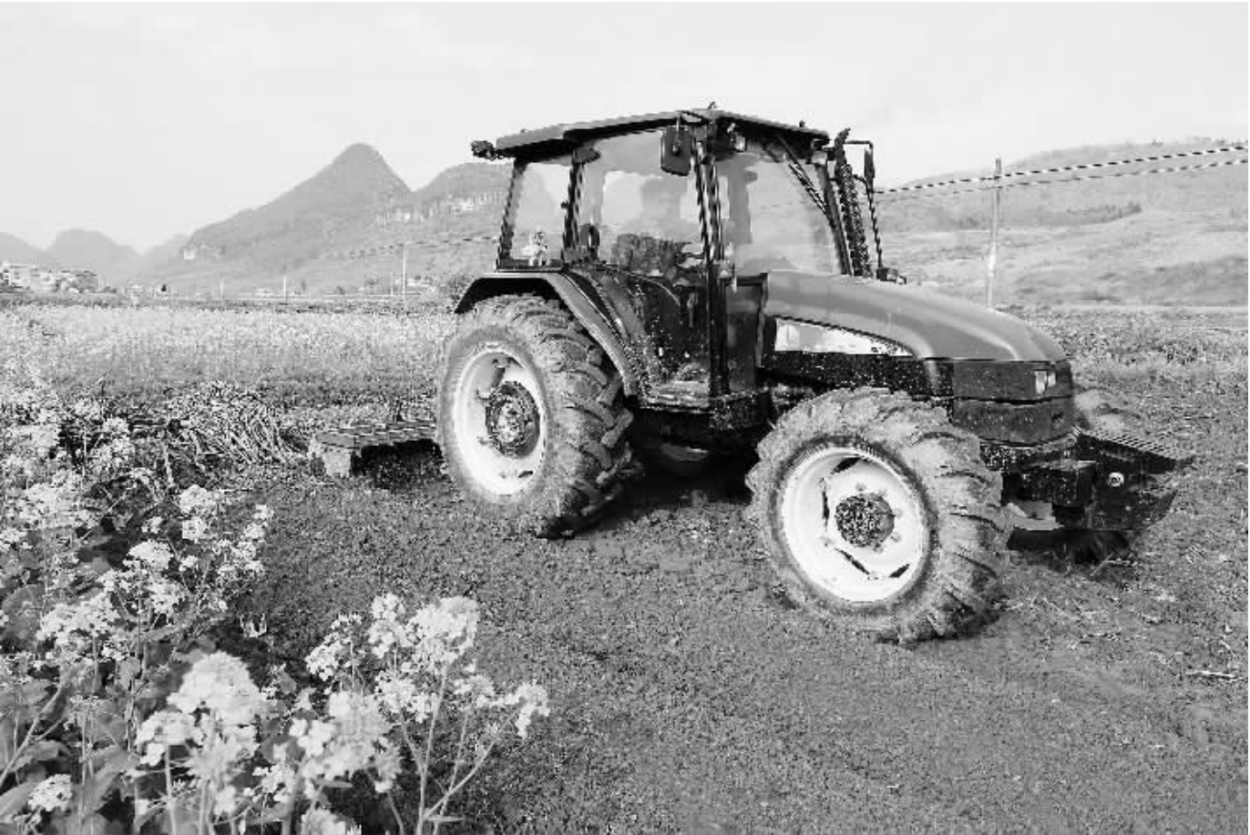
2月22日,在广西柳州市融安县东起乡崖脚村,一名男子驾驶拖拉机在田间耙地。近日,广西各地春意融融,最高气温普遍在22摄氏度左右,农民们抢时间投身春耕春种,田野上处处是劳作的身影。