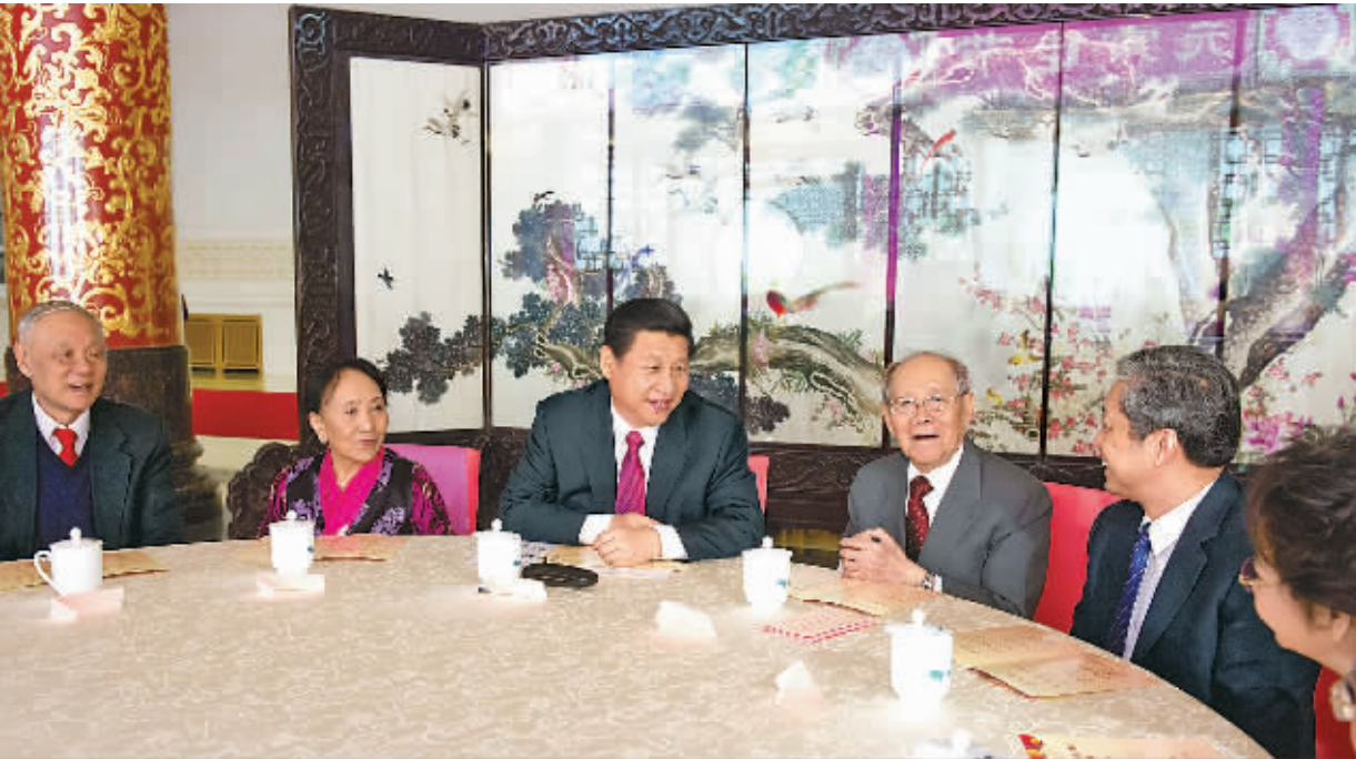
2月23日,中共中央在北京人民大会堂举行元宵节联欢晚会。这是习近平总书记在晚会上同知识界知名人士亲切交谈。