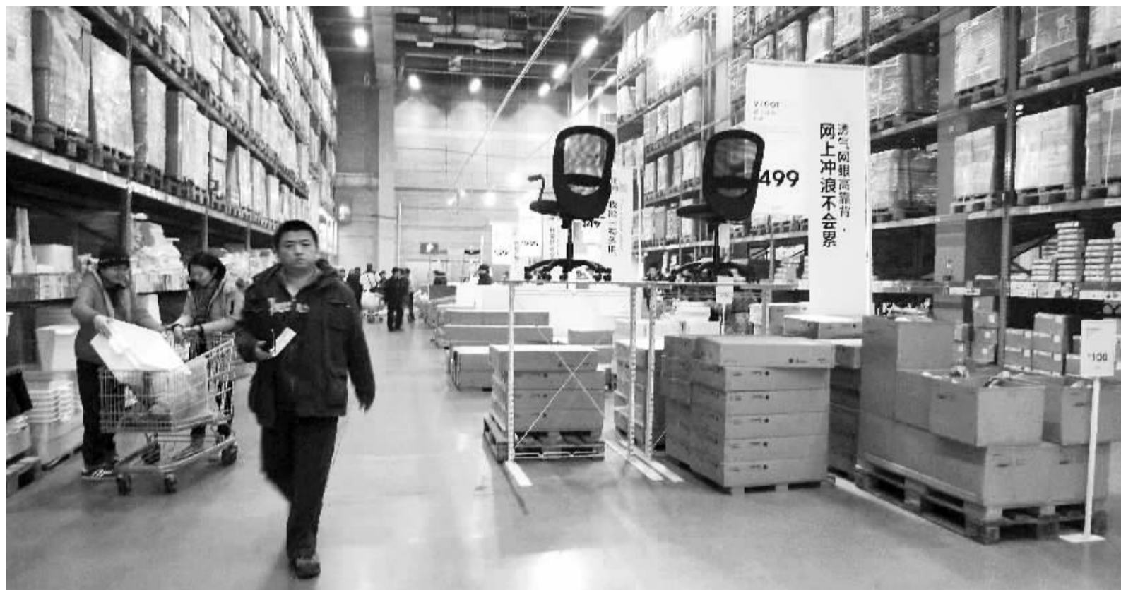
物流本来是家居类产品成本的大项，因为运输实在是太麻烦。但是，宜家通过“平板包装”，不仅提高运输效率和降低了运输成本，而且能够在装配上节省一大笔组装成本。