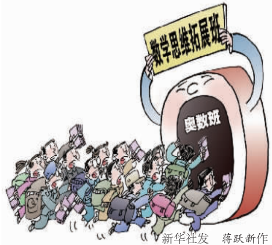
新华社发 蒋跃新作

近年来,教育部门三令五申禁止奥数成绩与义务教育阶段招生录取挂钩。但近期在重庆、广东等地各大培训机构,“疯狂奥数”改头换面重出江湖。