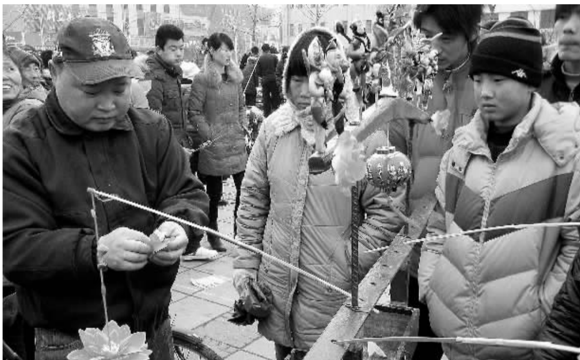
快过年了,江苏省丰县汉皇帝刘邦广场上,一些民间艺人施展出手艺,捏面人、吹气球、猜谜语等纷纷亮相,增添了浓厚的节日氛围。