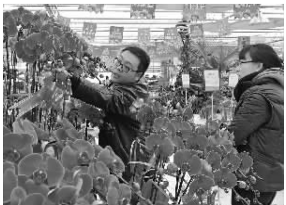
2月7日,北京世纪奥桥花卉园艺超市,市民在选购花卉。春节临近,鲜花消费进入高峰期,今年北京市准备了1500万盆年宵花供应春节市场。