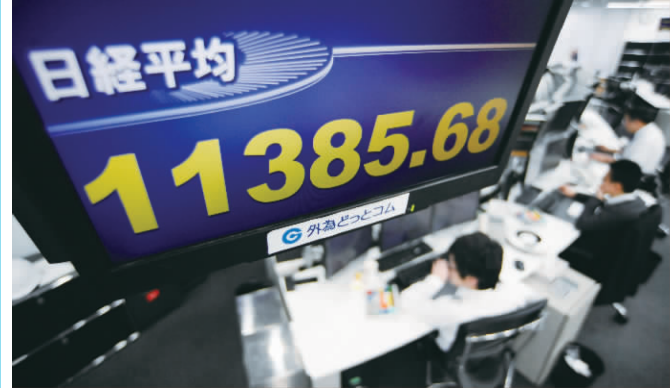
2月6日,在日本东京的一家股市交易所,工作人员在显示日经股指的电子显示屏下工作。受日本央行行长白川方明意外辞职表态促日元汇率急跌的刺激,6日东京股市日经225种股票平均价格指数比前一个交易日暴涨3.77%,创2008年9月29日以来的新高。

土库曼斯坦总统别尔德穆哈梅多夫要求有关部门认真研究加入世界贸易组织的有关问题,并与世贸组织负责人取得联系,开始启动谈判。土库曼斯坦内阁日前举行会议,再次研究加入世贸组织的问题,会议决定成立入世工作国家委员会。同时,决定在经济和发展部