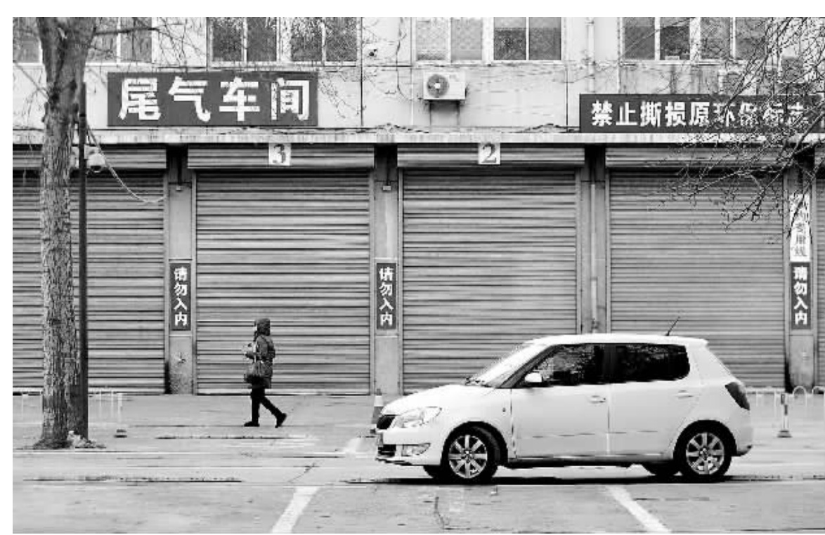
2月1日，车辆驶过北京一家汽车检测场尾气车间。根据北京市防治大气污染需要，国务院批准北京市从2013年2月1日起实施北京市第五阶段机动车排放标准（简称“京五”，相当于“欧五”标准）。本报记者 赵晶摄

资本和金融项目逆差（含净误差与遗漏）318亿美元，其中，直接投资净流入516亿美元。国际储备资产增加340亿美元（不含汇率、价格等非交易价值变动影响），其中，外汇储备资产增加347亿美元，特别提款权及在基金组织的储备头寸减少7亿美元。