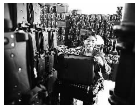
河北保定市白沟新城箱包加工企业正在加工拉杆箱包。

拉美国家是农民工市民化不成功的典型,1950年至1980年,拉美国家快速城市化,城市化速度大幅超过工业化速度,也明显超过欧美国家类似发展阶段的城镇化速度,大量城市人口贫民化,给拉美国家带来了十分棘手的、至今未能解决好的经济社会问题。