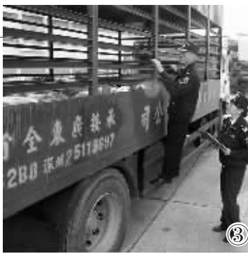
图③ 春节临近，深圳海关文锦渡口岸弹性延长工作时间，确保当日申报的鲜活商品当日审结放行。 尹晨摄