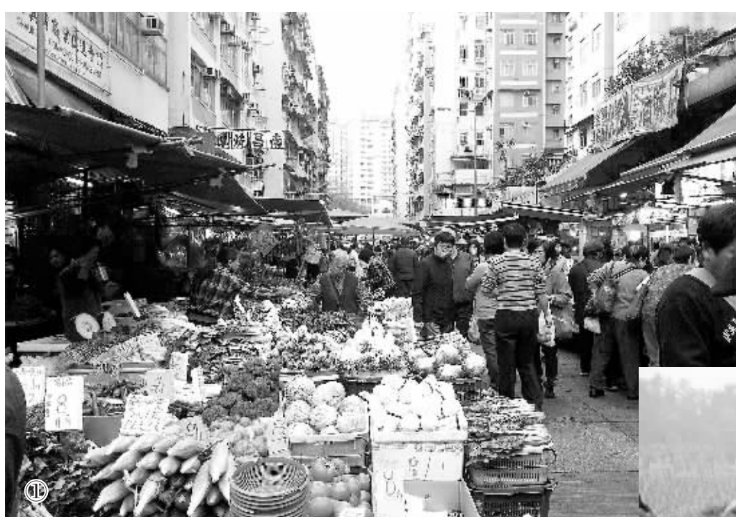
图① 1月29日香港筲箕湾街市上货品丰富的菜档。

家，冰鲜猪肉备案饲养场有161家。此外，为准确了解港澳市场对食品、农产品的需求，国家质检总局加强了与特区政府有关部门和业界的沟通；港澳人员也多次受邀参观考察内地种植和养殖基地，增进了对内地在供港澳食品及农产品质量安全方面的了解。