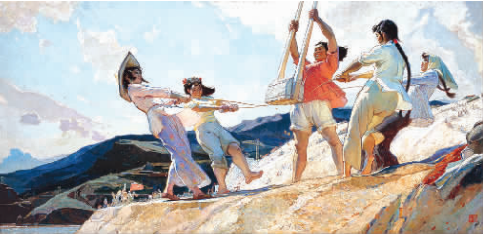
《奋歌》王文彬画 布面油彩 中央美术学院美术馆藏

1月18日，首次汇集国内10大美术馆精品的“群珍荟萃——全国十大美术馆藏精品展”在北京中国美术馆隆重开幕。参加展览的10大美术馆分别为：中国美术馆、中华艺术宫（上海美术馆）、江苏省美术馆、广东美术馆、陕西省美术博物馆、湖北美术馆、深圳市关山月美术馆、