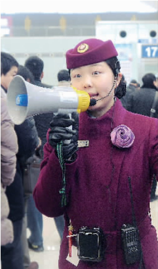
1月24日,河北石家庄火车站候车室工作人员组织旅客排队检票进站。