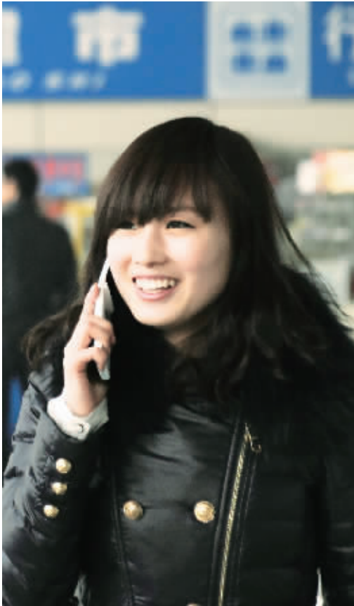
1月25日,旅客在山东滨州汽车站大厅告诉亲人们即将回家的消息。