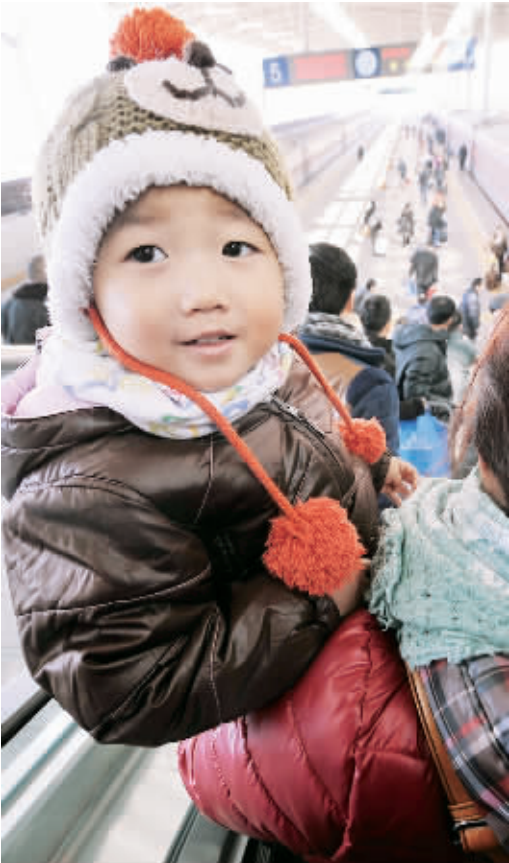
1月24日,宁夏火车站,孩子们跟随他们的父母开始了返乡之路。

各种运输方式协调配合,将能缓解春运期间运能的不足。比如铁路部门可以和公路客运部门联手,在外出农民工集中的地区开通临时客车,在固定时间到火车站接人,减轻汽车运