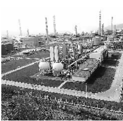
图为位于四川省达州市宣汉县的中国普光 气田天然气净化厂。据悉,自2010年8月31 日至今年1月22日,“川气东送”管道已累 计外输天然气逾173亿立方米。