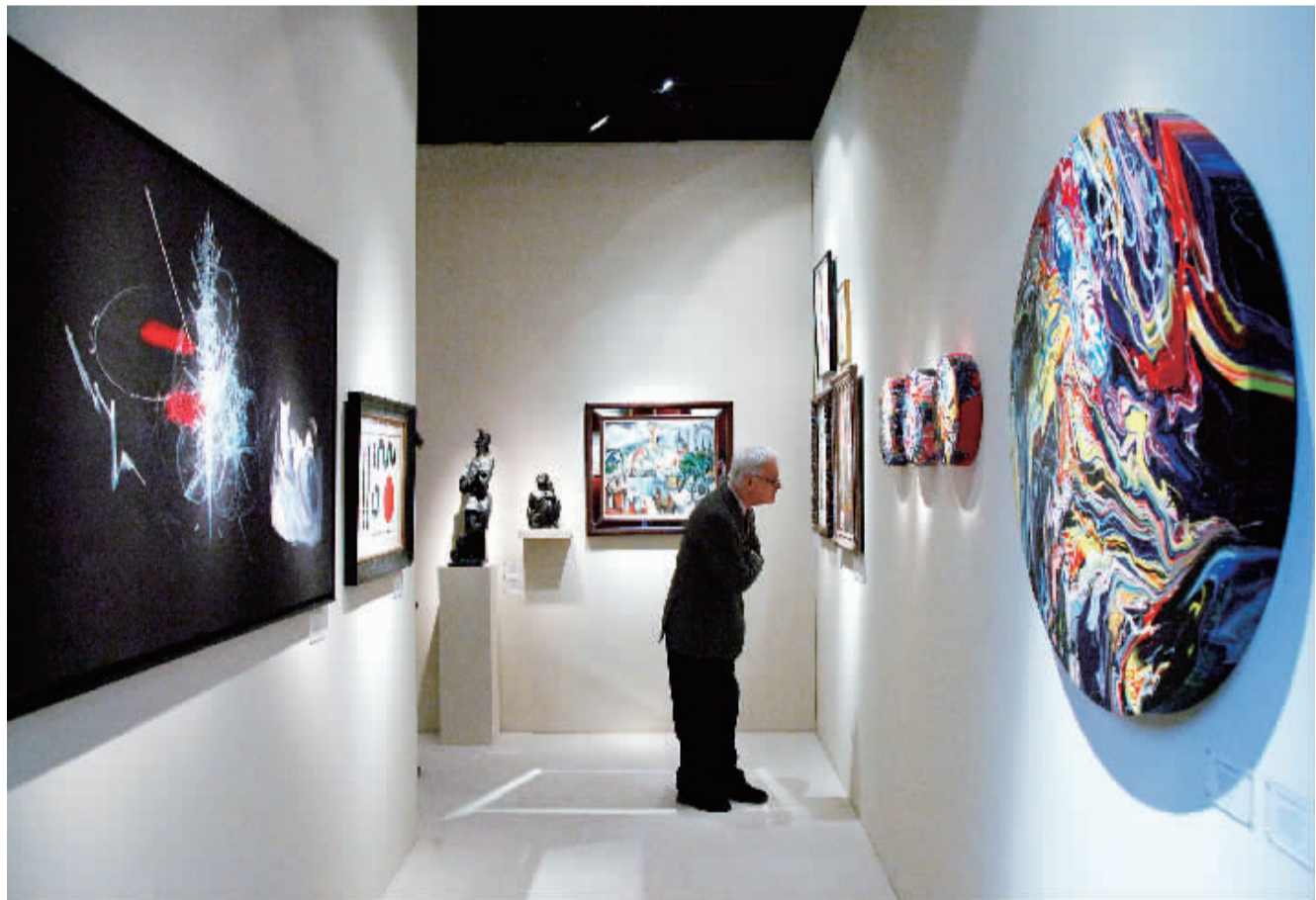
1月19日,在比利时布鲁塞尔举行的古董和艺术品展览会上,参观者欣赏展出作品。当天,为期一个星期的第58届布鲁塞尔古董和艺术品展览会在布鲁塞尔开幕,共有来自10个国家和地区的128家古董或艺术品代理行参加。

欧洲央行指出,自1999年以来,虽然不断有新成员加入欧盟和欧元区,但货币金融机构数量却一直呈现下降趋势。同1999年相比,2013年欧元区的货币金融机构数量减少2797家,降幅为28%,欧盟则减少1833家,降幅为17%。