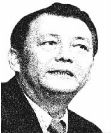
国家统计局原总经济师兼新闻发言人

姚景源，现为国务院参事室特约研究员。长期从事宏观经济分析与研究工作。曾先后在国家经委、商业部、国内贸易部任职，也曾担任过安徽省政府副秘书长、安徽省阜阳市市长。