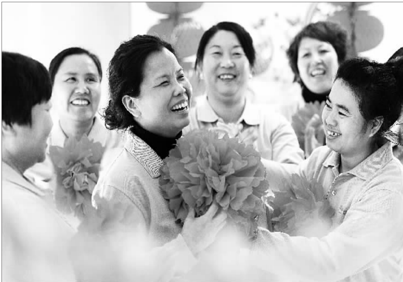
1月16日，北京倍优天地公司举行优秀家政服务员表彰会。该公司在提供优质服务的的基础上，不断提高员工待遇，留人更留心。

北京市针对春节期间的“保姆荒”、“月嫂荒”，各大家政企业加大招工力度，相继出台了各种奖励措施，完善应急保障体系，保证北京家政市场过节不“荒”。据悉，北京16家政府扶持发展的家政企业和55家星级家政企业以及200余家会员单位，采取提前储备、错峰回家等措施，确保首都家政服务市场需求。