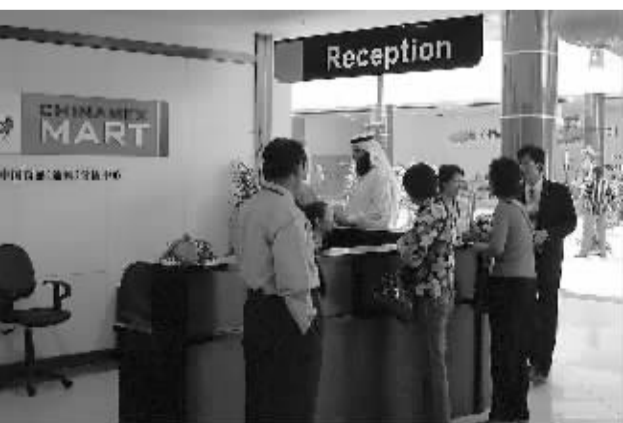
图为中国商品(迪拜)分拨中心。