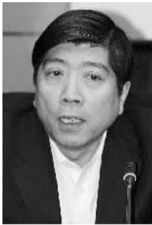
霍建国,商务部国际贸易经济合作研究院院长。

答: 2011年中国的出口总额占全球比重达10.4%,连续3年居全球之首;进口总额占世界总量的9.5%,连续3年位列全球第二。随着国内外环境的深刻变化,中国外贸可能难以再现以往的持续高速增长。目前的核心任务是加快转变增长方式,构建新的竞争优势,而适当保持外贸增长压力,对产业结构调整有好处。从长远看,巩固制造业的竞争优势,加快发展先进制造业,是我国经济实现稳中求进的一大支柱和法宝。只要把制造业的竞争力巩固住,就不愁外部没市场,中国未来三五年的外贸增长空间就有保障。党的十八大报告提出,到2020年全面建成小康社会,实现国内生产总值和城乡居民人均收入比2010年翻一番。如果我们成