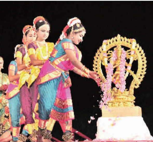
1月8日,在印度泰米尔纳德邦小镇玛玛拉普兰,演员在表演舞蹈。当日,一年一度的印度舞蹈节在印度泰米尔纳德邦小镇玛玛拉普兰举行。

2012年,尽管家电市场相对低迷,LG电子仍然凭借高端产品带来的高利润实现了正向增长。慎文范明确表示,LG电子将继续向高端化发展,以保持产品和技术领先。同时,LG将在中国市场推行更加积极的渠道政策,专门为三四级市场开发适合的产品,并且结合自身产品线多的特点,在二级市场中设立LG品牌店,以开拓市场。