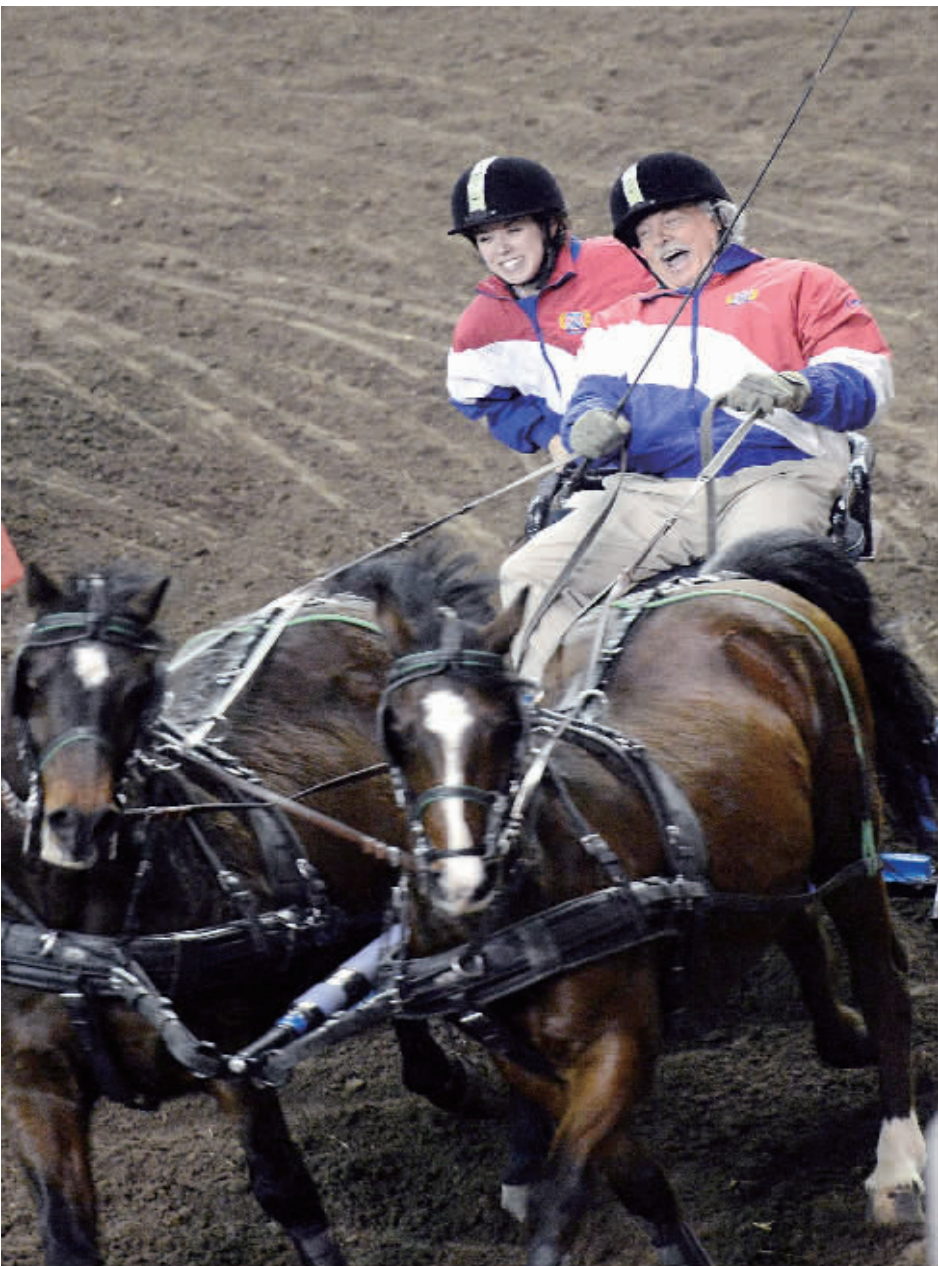
1月8日,在美国宾夕法尼亚州哈里斯堡举行的农场秀上,两名骑手参加场地马车技巧的表演赛。美国宾夕法尼亚州农场秀是美国国内最大的室内农业展。

好转也是不太可能的。除了德国、奥地利、卢森堡等几个劳动力市场始终较为稳定的国家外,其他国家可能在未来两年内仍将会饱受高失业率的困扰。有专家甚至预言,欧元区从此进入高失业率时代也在所难免。