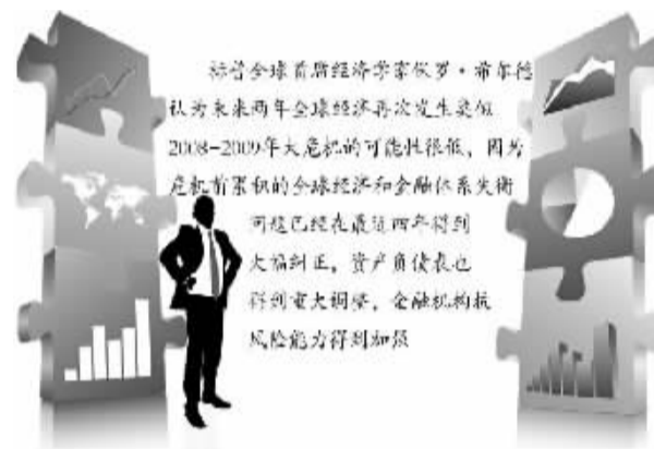
根据IMF最新报告预测