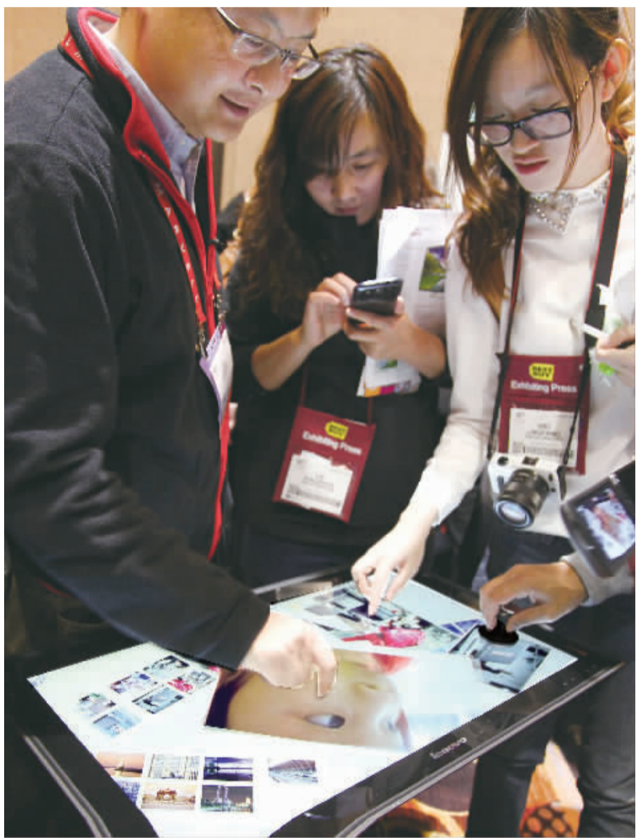
1月6日,在美国拉斯韦加斯举行的国际消费电子展媒体预览上,联想工作人员演示其“智能桌面”产品。当日,联想集团在拉斯韦加斯国际消费电子展媒体预览活动中发布了一款“智能桌面”产品。