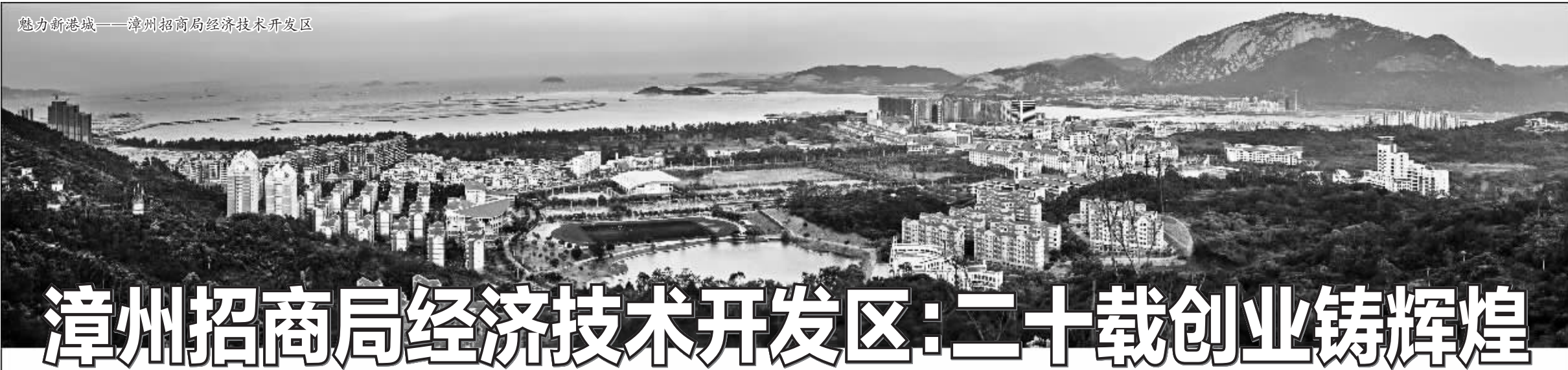
魅力新港城——漳州招商局经济技术开发区