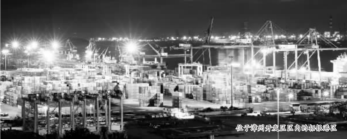
位于漳州开发区区内的招银港区