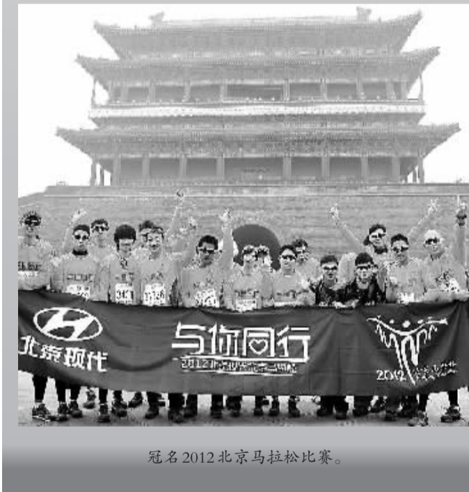
冠名2012北京马拉松比赛。