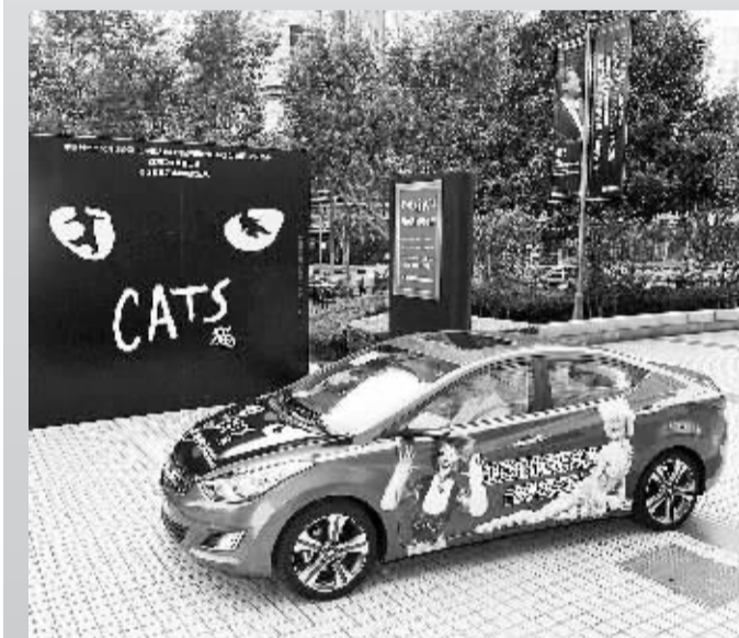
赞助音乐剧《猫》中文版。