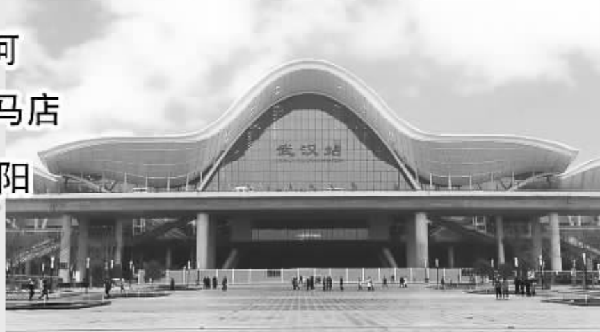
G1103 武汉—广州 发 07:15 到11:09 G1159 武汉—广州 发 19:20 到23:44

G79 北京西—广州南 发 10:00 到 17:59 G81 北京西—广州南 发 13:05 到 22:22 G6701 北京西—石家庄 发 10:28 到 12:01 G6713 北京西—石家庄 发 22:03 到 23:22 D2021 北京西—郑州东 发 12:13 到 17:11 G565 北京西—郑州东 发 19:55 到 23:14 G507 北京西—武汉 发 7:00 到 12:23 G527 北京西—武汉 发 18:04 到 23:12 G501 北京西—长沙南 发 7:30 到 14:12 G505 北京西—长沙南 发 15:40 到 22:31