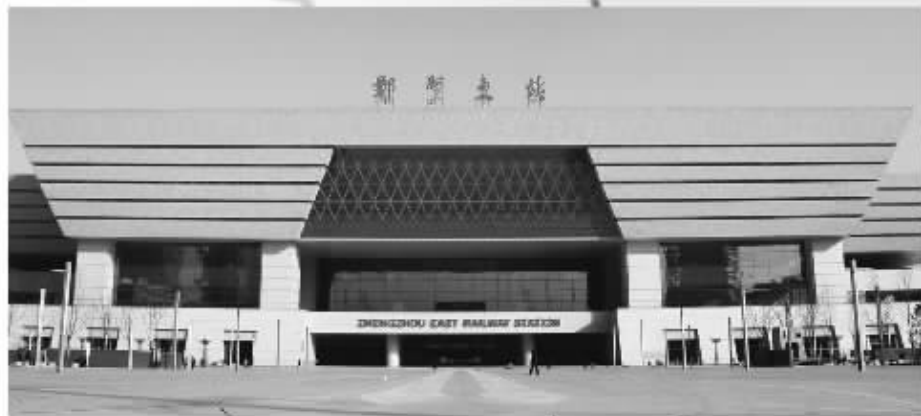
G311 郑州东—武汉 发 9:22 到 11:11 G369 郑州东—武汉 发 22:04 到 23:52