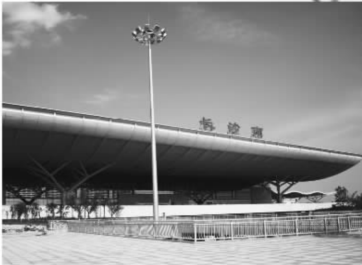
G502次 长沙南—北京西 发 7:30 到14:07 G506次 长沙南—北京西 发 15:08 到21:50