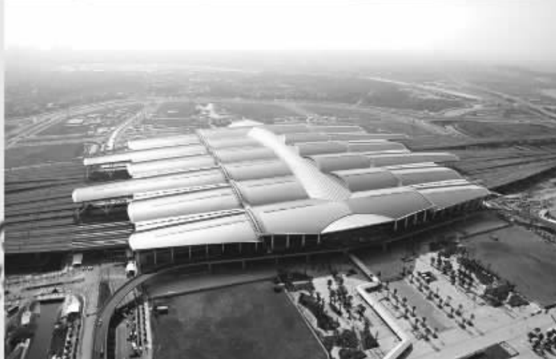
广州南至北京西高速动车组每日始发2趟，至西安北5趟、太原1趟、石家庄1趟、郑州1趟、郑州东4趟、信阳东2趟。广州南至北京西最快为G80次列车，10时在广州南站始发，17时59分终到北京西站。