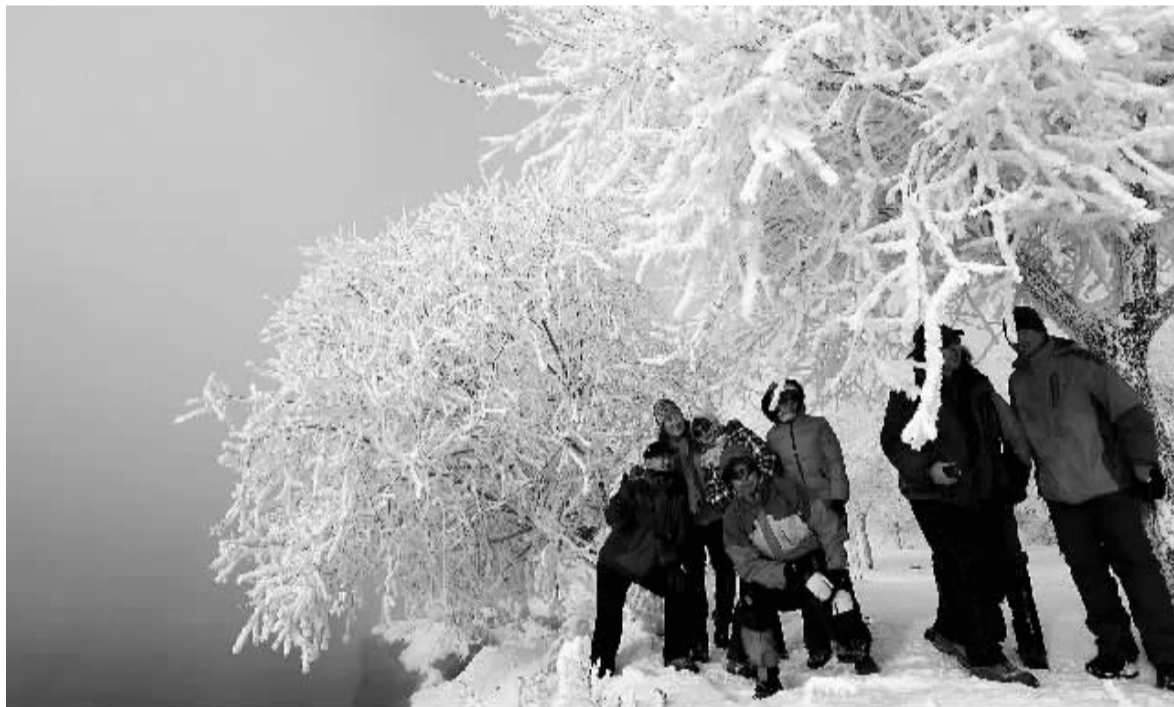
上图 初冬时节,位于吉林省吉林市丰满区阿什村的小雾凇岛银装素裹,一派北国风光,吸引大批游人前来赏景游玩。