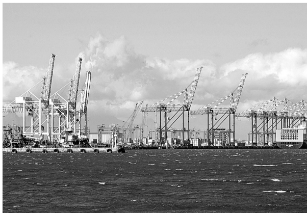
南非开普敦维多利亚港码头。

为此,多数国家呼吁和强调,应在二十国集团框架内,积极协调各自宏观经济和金融货币政策,拿出真诚合作的政治意愿,趋利避害,互利共赢,最终形成共同繁荣发展的世界经济新格局、新秩序,这是克服当前困难,赢得挑战的上策,也是可持续发展之路。