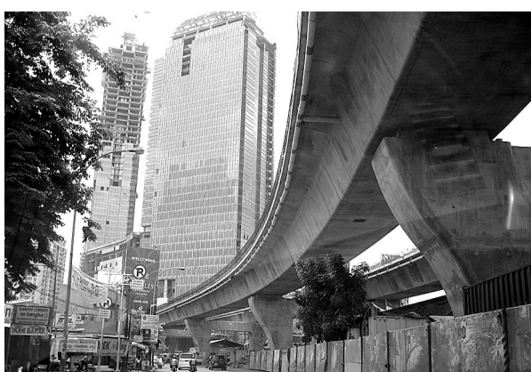
印尼高架桥正在施工。