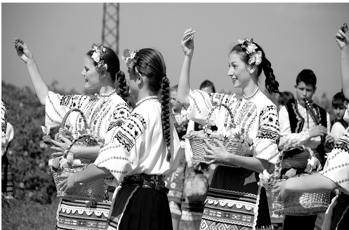
保加利亚姑娘向前来观玫瑰节盛典的外国游客抛撒玫瑰花瓣。

受全球经济整体下滑和欧债危机影响,保加利亚经济2012年上半年一度陷入衰退。由于政府采取了一系列提振措施,经济运行从第三季度起缓慢回升。对于保加利亚2013年经济走势,政府预测增长1.6%至1.9%。专家认为,该国经济恢复进程从2012年开始提速,但要恢复到危机前的年增速4%,至少需3年时间。