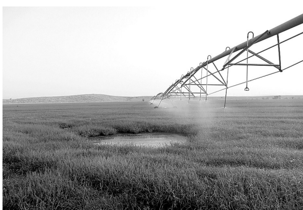
沙特利用灌溉技术种植苜蓿等农作物。