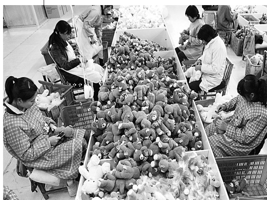
上图 江苏省连云港市赣榆县一家玩具企业的员工在生产出口欧美的毛绒玩具(2012年12月6日摄)。