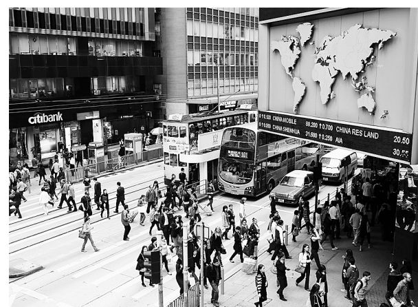
行人穿过香港中环金融中心的一处斑马线(11月29日摄)。12月5日,中国城市竞争力研究会在香港发布第十一届中国城市竞争力排行榜。在其中的城市综合竞争力排行榜上,香港、上海和北京位居前三。