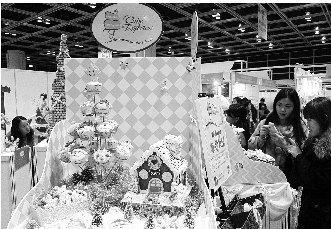
12月5日,观众在展会上参观拍摄蛋糕模型。当日,为期3天的香港国际烘焙展在香港会展中心开幕。展会吸引了来自世界10余个国家和地区的参展商,展示各式烘焙制品,交流最新烘焙技术,让公众了解烘焙文化。新华社发