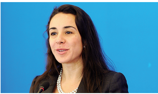
巴西驻华使馆公使衔参赞 罗西娅

金砖国家需要一起达到怎样的目标呢？当务之急是如何能够求同存异，相互补充，加强在多个领域的合作。目前，金砖国家在以下3个领域可以进行合作和协调：