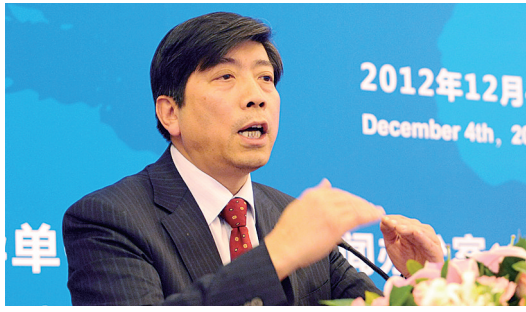
商务部国际贸易经济合作研究院院长 霍建国

未来金砖国家在国际经济政策协调中将扮演更重要的角色，但与此同时，其他国家对其承担国际责任的期望和要求也会不断提高。这就要求金砖国家全面认识自身国情和发展阶段，进一步加强彼此间的合作，保持经济持续增长。