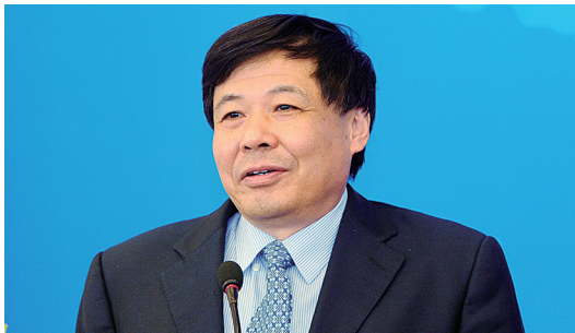
财政部副部长 朱光耀

金砖国家经济具有巨大的潜力，近年来显示出了极大的活力，人民生活水平不断地提高。但同时，国际金融危机对金砖国家的经济发展也造成了影响。如何准确把握形势，采取正确的应对措施，关键在我们能否加强金砖国家的政策协调，推进金砖国家的经济合作。近年来，全球经济增量部分的50%以上来自金砖国家的贡献，这充分显示了金砖国家经济的活力。同时，也深刻地揭示了世界经济格局的巨大变化，凸显了世界治理机制改革的紧迫性和重要性，金砖国家要在国际经济事务中有更多的代表性和发言权。