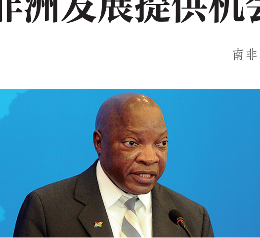
南非驻华大使 兰 加