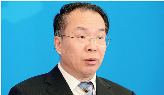
国务院新闻办副主任 王国庆

当前，国际金融危机的深层次影响还在发展，各国经济增速不同程度地减缓，欧债问题跌宕起伏，世界经济复苏艰难曲折。在这场危机中，金砖国家经济也受到明显冲击，主要表现为经济增速下滑、企业经营困难、对外贸易受挫、回升势头乏力，经济发展面临严峻挑战。在这样的背景下，经济日报社发起举办首届金砖国家经济形势研讨会，以“金砖2013：挑战与机遇”为主题，分析展现金砖国家经济形势和前景，探讨经济合作的途径举措，对于金砖国家之间加强交流、形成共识、共同应对危机挑战，带动全球经济回暖复苏，具有十分重要的意义。