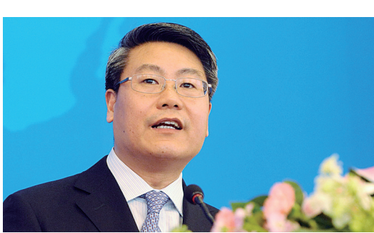
商务部部长助理 李荣灿

商务部部长助理 李荣灿 国家的投资合计已经达到230亿美元。 展望未来，金砖国家经济有望继续保持较快增长，消费市场不断扩大，基础设施建设明显加快，相关产业发展方兴未艾。所有这些，都将为金砖国家深化经贸合作提供更加广阔的前景，为扩大相互贸易和投资带来大量机会。 目前，全球经济形势难以令人乐观。世界经济运行中的不稳定不确定因素依然突出，全球金融危机的深层次影响远未消除，新的风险在一定程度上还在滋生和积累，导致世界主要经济体增长乏力，全球总需求不足，国际贸易减退，保护主义有所抬头。受此影响，金砖国家经济增速也从高位滑落。