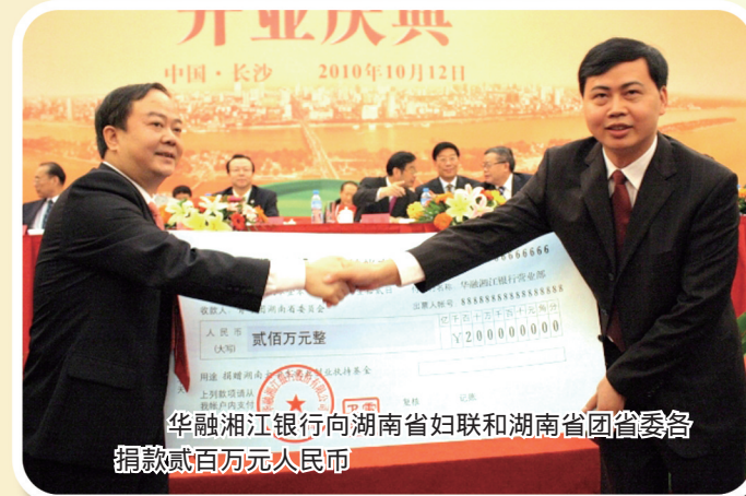
华融湘江银行向湖南省妇联和湖南省团省委借款贰佰万元人民币