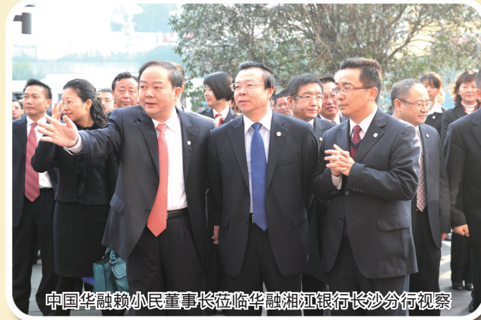
中国华融赖小民董事长莅临华融湘江银行长沙分行视察

展望未来，华融湘江银行将一如既往地坚持以市场为导向，以客户为中心，以质量效益为目标，以改革发展为主线，以流程再造为主线，以科技创新为动力，以稳健规范为保障，走“市场化、多元化、差异化、区域化、资本化、国际化”的发展道路，按照“有尊严、有价值、有内涵、有实力、有责任”的现代金融企业愿景，努力建设成为立足湖南、辐射全国、治理完善、资本充足、经营稳健，管控有力，业绩突出，具有品牌价值和核心竞争力的现代商业银行。