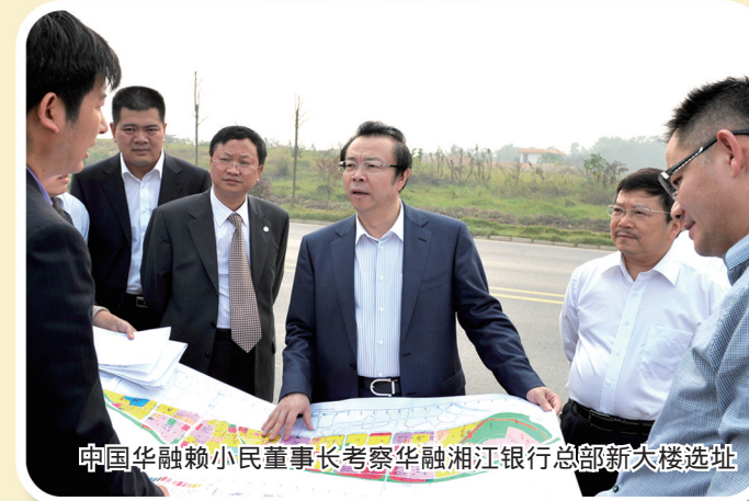
中国华融赖小民董事长考察华融湘江银行总行新大楼选址