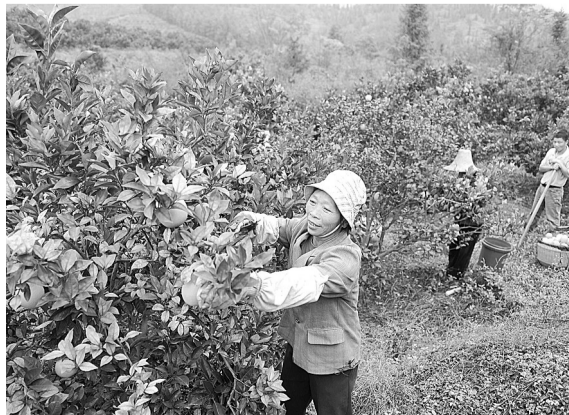
11月21日,江西省龙南县黄沙管委会畲族村村民正在果园里采摘脐橙。今年,赣南老区脐橙喜获丰收,成为当地农民增收致富的主导产业。