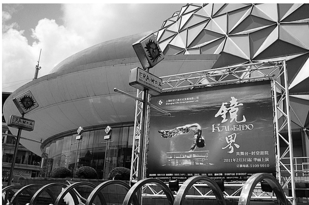
继《时空之旅》后,上海杂技团又推出了多媒体梦幻剧《境界》,其中更多高科技多媒体技术和创造性构思给观众带来惊喜。

按照规划,十二五时期上海文化演出营业总收入增长幅度、剧场演出场次增长幅度预计达到50%。届时,精彩纷呈的演艺市场,将极大丰富市民的文化生活。