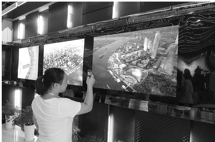
上图:今年8月,东方梦工厂宣布落户上海。一位参会者正在用手机拍摄东方梦工厂设计蓝图。