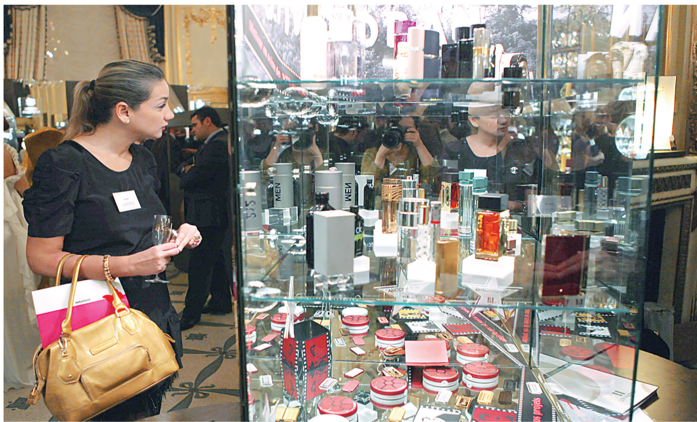
11月20日,人们在法国巴黎举行的黄金广场第10届巴黎奢侈品包装设计沙龙上参观。为期三天的黄金广场第10届巴黎奢侈品包装设计沙龙,当日在巴黎莫里斯酒店开幕,法国数十家顶级奢侈品包装设计公司在这里向观众展示富于灵感创意的作品,包括化妆品、香水、巧克力、红酒以及高级定制的礼品创意和设计。

2012年,许多跨国公司、财团、风投基金和对冲基金等瞄准了中东地区电子商务市场的增长潜力,纷纷注资帮助其实现大规模扩张。但中东地区的电子商务发展也面临着一些挑战,尤其是支付手段和配套物流服务不健全严重制约了行业的发展。目前,该地区70%的网购用户倾向于货到付款的支付方式,而有关数据显示采用这种支付方式的退货率比第三方支付、信用卡支付等高出7倍,进而增加了商家的经营成本和物流成本。今年11月中旬,全球最大的第三方在线支付工具贝宝(Paypal)宣布正式进驻中东市场,有望在一定程度上缓解这一问题,成为促进中东电子商务发展的一大动力。