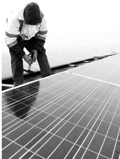
新兴产业已成为各国竞争的制高点,图为瑞士最大的楼顶太阳能发电站。