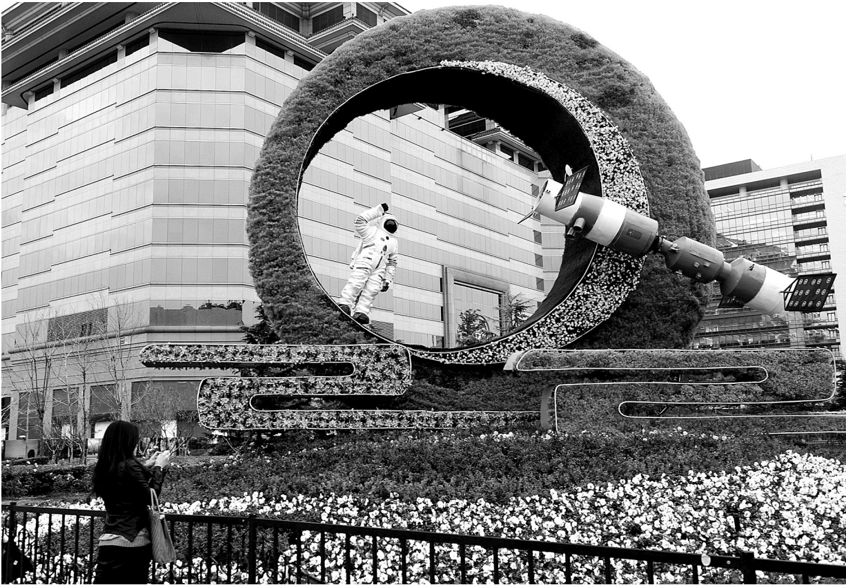
北京西单街头的花坛前，市民驻足拍照留念。