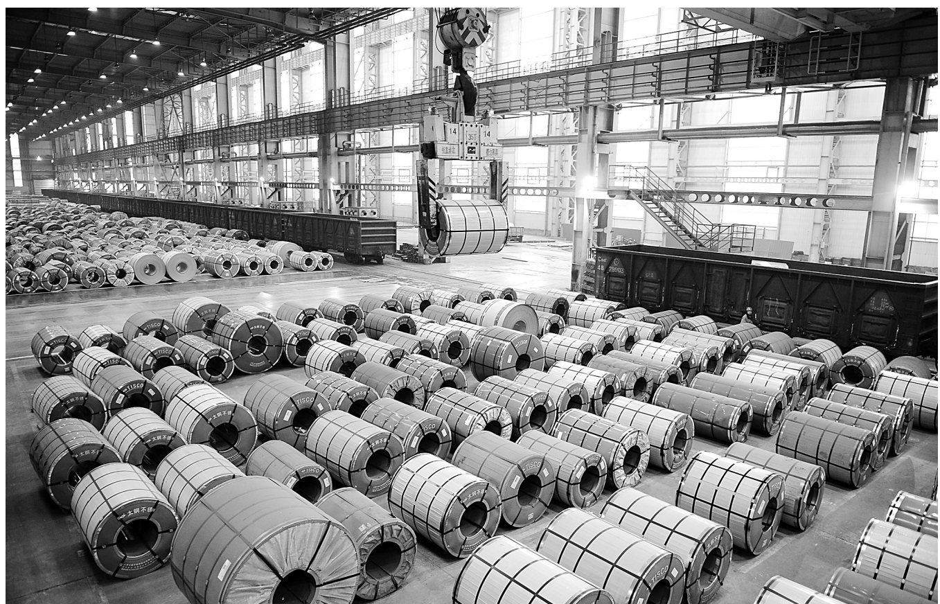
11月15日,太钢集团的工人在往火车上装运不锈钢卷。今年以来,钢铁产业遭遇前所未有的寒流。面对严峻的市场形势,全球最大的不锈钢企业太原钢铁(集团)有限公司通过加强基础管理,主推高技术、高附加值的高端不锈钢品种,在整个行业不景气的背景下逆势上扬,今年前三季度累计实现营业收入1055.41亿元,同比增长11.4%。

评价程序包括企业自评和中介机构评价。中央企业集团公司应将企业自评形成综合书面材料,于2012年12月20日前上报财政部。财政部将委托资产评估等中介机构,对部分企业集团国资预算支出项目开展第三方评价。评价方法包括现场调查、座谈、单独访谈、问卷调查、调阅资料等。被评单位应予积极配合。