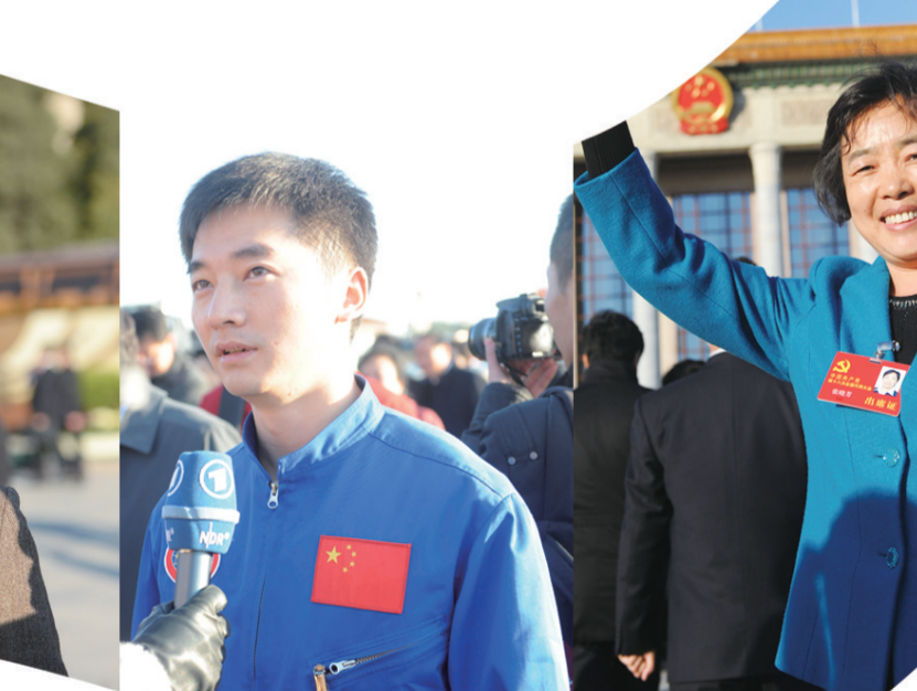
下图 11月14日,参加完党的十八大闭幕会的代表们满怀信心走出会场。