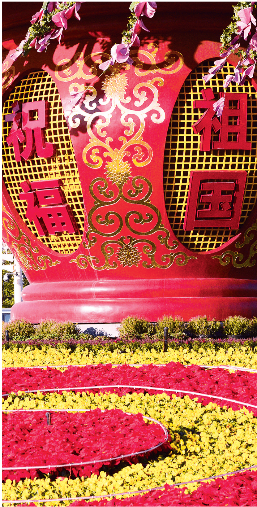
上图 11月14日,天安门广场花园锦绣,洋溢着喜庆的气氛。

作为我国战略性新兴产业的重要组成部分,物联网产业已深入到经济社会发展的各个领域。党的十八大报告明确提出要推动战略性新兴产业、先进制造业健康发展,让人倍受鼓舞。 确保到2020年实现全面建成小康社会宏伟目标,为战略性新兴产业发展奠定了良好的经济和社会基础;坚持走中国特色新型工业化、信息化、城镇化、农业现代化道路,将对物联网这种新一代信息技术提供非常广阔的技术应用空间;实施创新驱动发展战略,必将进一步加大对新兴产业,加大对我们科技型企业的支持。 所谓健康发展,就是要让战略性新兴产业跟经济社会发展相适应,跟人民生活相结合,使自身发展更多地依靠市场需求驱动而不是国家投入驱动。(本报记者 董碧娟整理)