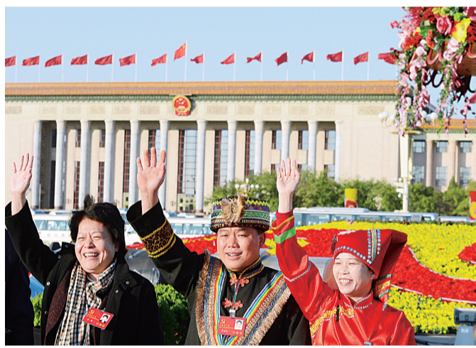
11月14日,中国共产党第十八次全国代表大会胜利闭幕。步出会场,代表们心情激动,纷纷在天安门广场合影留念。

奋进之路党引领,征程阔步向未来。沈阳、北京、兰州、济南、南京、广州、成都军区以及武警部队官兵纷纷表示,一定要认真学习十八大精神,以更加坚定的决心、更加有力的举措、更加完善的制度,把学习贯彻的成效体现到推动部队建设科学发展上,体现到做好军事斗争准备上,体现到部队战斗力的提高上,在新的历史起点上不断开创国防和军队现代化建设新局面。