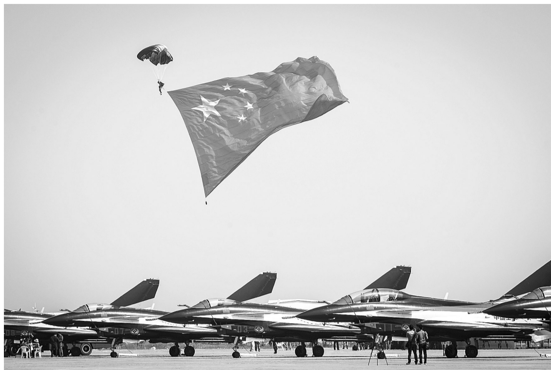
上图 11月13日，空军八一跳伞运动大队运动员在珠海机场上空展开一面篮球场面积大小的五星红旗，五星红旗下方为中国空军八一飞行表演队的歼10战机。