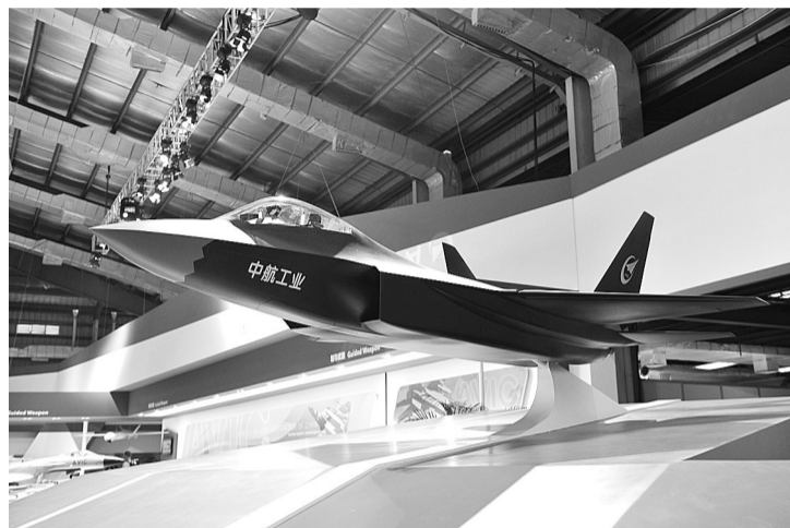
左图 这是中航工业展厅内展出的新型战机模型(11月12日摄)。