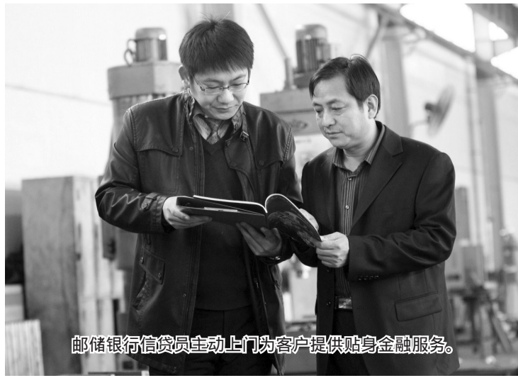
邮储银行信贷员主动上门为客户提供贴身金融服务。

2008年，北京分行针对农户、农商户、涉农小微企业放款量保持了较快增长，融资支持涉及京郊面粉加工、蔬菜种植、食品加工、家禽养殖、肉食品加工等多个连接“三农”的中间企业，带动了京郊农业产业的不断发展。在此基础上，邮储银行不断加大产品创新力度，与北京市农担公司合作开发农户、专业合作社、涉农企业等贷款产品，今年4月27日，成功参与发行全国首支农产品加工业小微企业集合票据。仅2011年，北京分行就帮助上千名农户、近百个农村专业合作社完成了农业设施的建设和产业结构的调整。