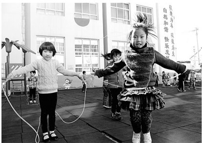
10月17日，山西省高平市寺庄镇中心幼儿园的小朋友在进行课间活动。十一五期间，高平市共投入5000余万元改扩建农村幼儿园。