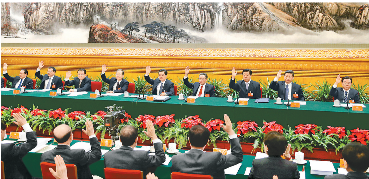
上图 11月13日,中国共产党第十八次全国代表大会主席团在北京人民大会堂举行第三次会议。胡锦涛、吴邦国、温家宝、贾庆林、李长春、习近平、李克强、贺国强、周永康等出席会议。