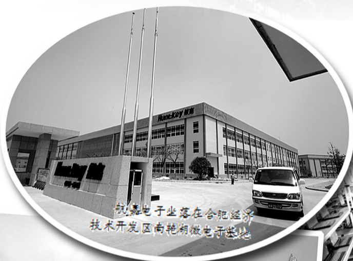
联想电子坐落在合肥经济技术开发区南艳湖微电子基地