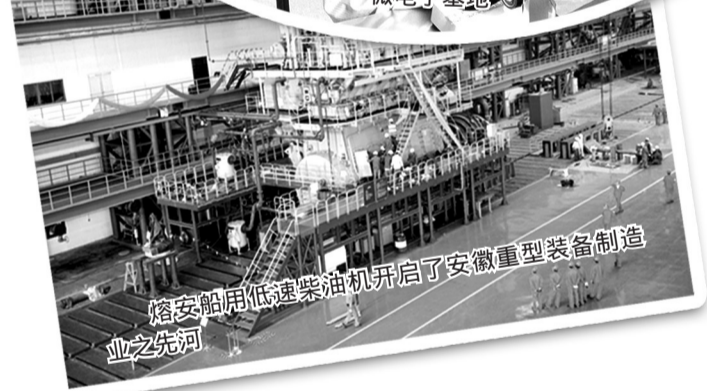
熔安船用低速柴油机开启了安徽重型装备制造之先河

大湖名城，创新高地。合肥，以新型工业化带动新型城市化，正在掀起现代化新兴中心城市的建设热潮。