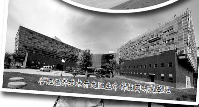
合肥经济技术开发区生命科技园皖基地