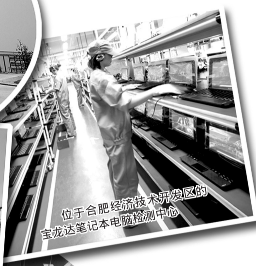
位于合肥经济技术开发区的宝龙达笔记本电脑检测中心